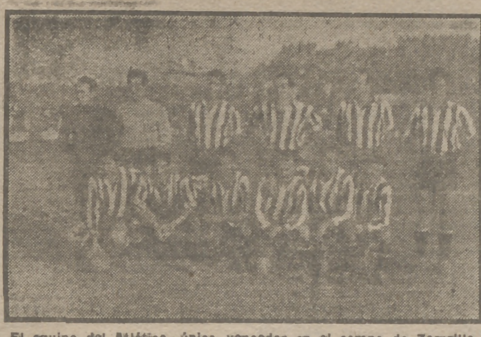
El equipo del Atlético, único vencedor en el campo de Zorrilla en la primera vuelta de la Liga.