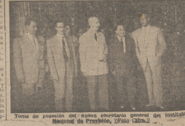
Toma de posesión del nuevo secretario general del Instituto Nacional de Previsión.

Vertical text on the right edge of the page, partially cut off, containing various news snippets and headlines.