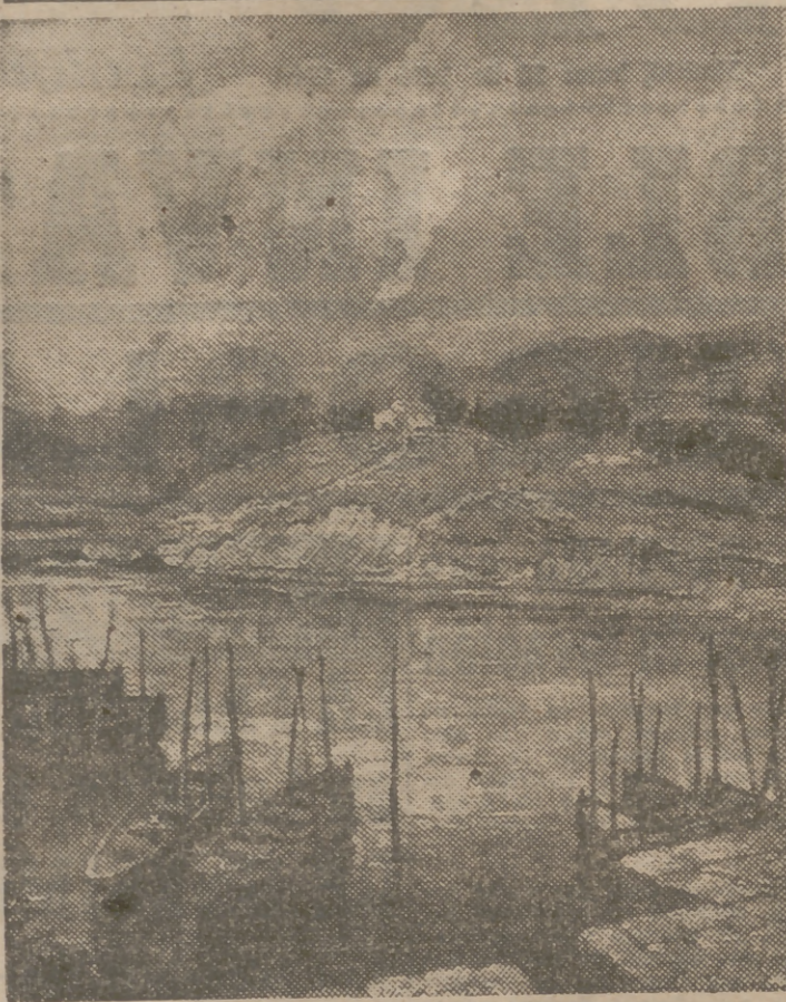
"Bateles", por Jesús Apellániz.