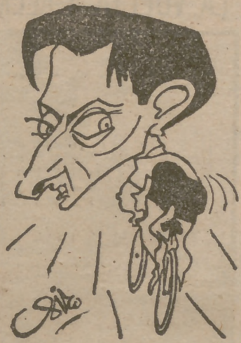
Fausto Coppi, el gran vencedor.