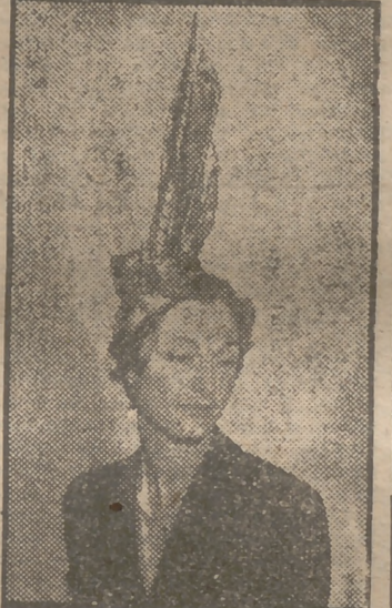
"Pararrayos" es el título de este modelo de sombrero de alta fantasía, presentado en París.