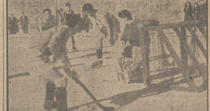
El Canoe se impuso sobre el Colegio Mayor en el partido de hockey sobre patines jugado ayer.

Vertical text on the right edge of the page, likely from an adjacent page or a sidebar, containing names and partial text.