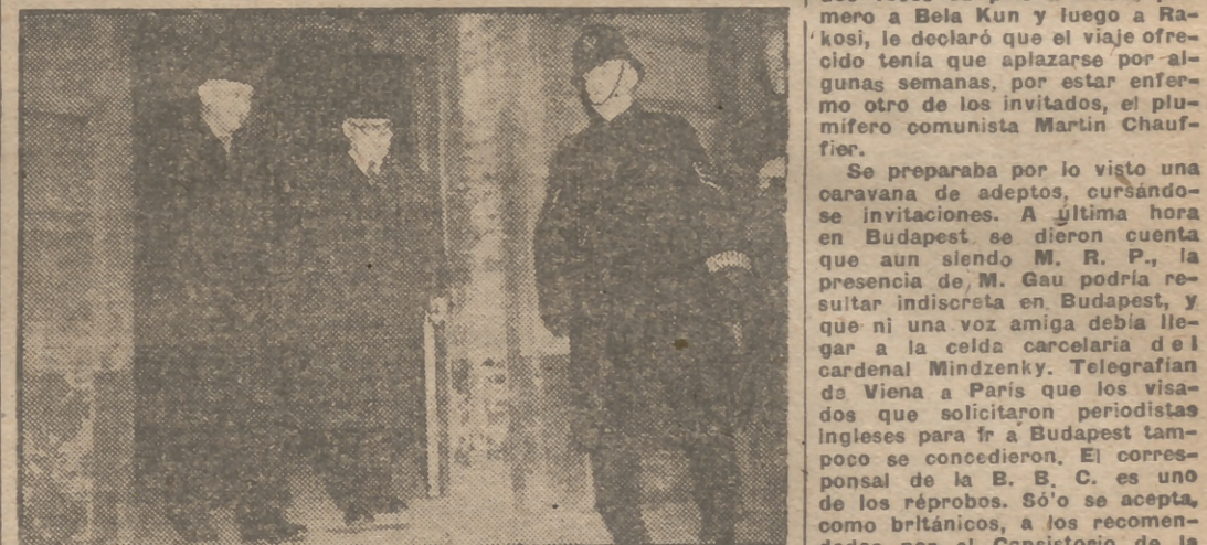
Un policía británico (a la derecha) vigila cuando el sonriente Robert Schuman es escoltado a su llegada a la estación Victoria de Londres y donde fué recibido por Ernest Bevin con gesto severo. El ministro de Asuntos Exteriores francés permaneció en la capital británica tres días, en los que se dice discutió todas las fases de los asuntos relacionados con Francia y Gran Bretaña y especialmente la Unión de la Europa Occidental y el control de Alemania.