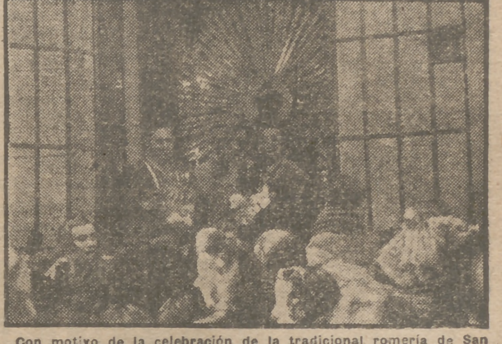
Con motivo de la celebración de la tradicional romería de San Antón se ha celebrado hoy la bendición y entrega simbólica de la cebada en la iglesia de los Padres Escolapios, sita en la calle de Hortaleza.

Esta tarde se ha verificado la bendición y entrega simbólica de la cebada