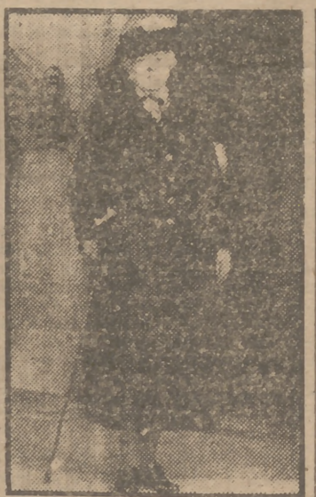
La ex reina Amelia de Portugal, que se encuentra enferma en Versalles.

Treinta y cinco años de destierro, después de haber visto el asesinato de su esposo y de su hijo Luis Felipe