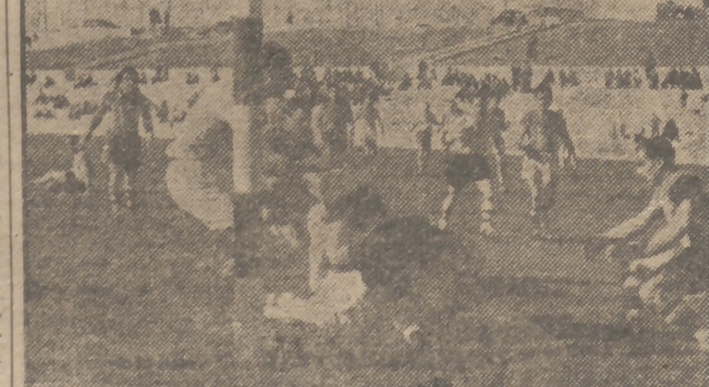
Una jugada decisiva en el match de rugby Atlético-S. E. U.

PARIS, 15.—El partido internacional de rugby entre Escocia y Francia ha terminado con la victoria de los escoceses por ocho puntos contra cero. GARDIFF, 15.—Inglaterra y el País de Gales han empatado esta tarde en su partido internacional de rugby al terminar el primer tiempo. El indicador aparecía con tres puntos cada uno. En el segundo tiempo dominó el bando galés, que ganó al final por nueve puntos contra tres.