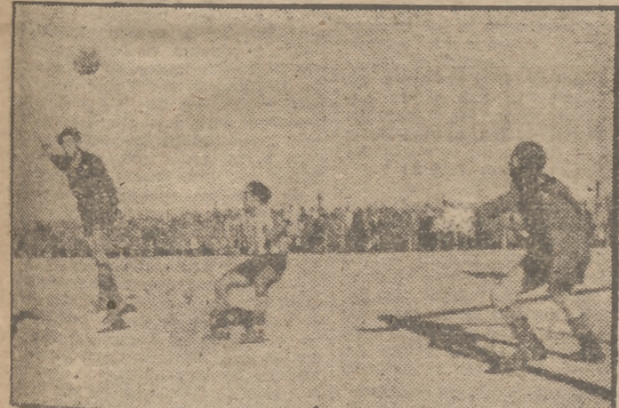
Una interesante jugada en el partido de fútbol regional jugado ayer entre el Vestimenta y el Cuatro Caminos.

Motro, 3; P. Máv, 1. Chambrío, 1; Victoria, 1. San Antonio, 1; Guadalupe, 1. Vestimenta, 3; C. Caminos, 4. Amparo, 5; Girod, 2. Leganés, 1; Electro, 2. Puig, 2; Narváez, 1. Plus Ultra, 0; Bayo, 5.