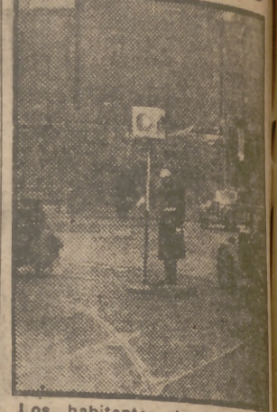
Los habitantes de la ciudad alemana de Francfort se encuentran intrigados por el funcionamiento de las nuevas luces de tráfico. El policía acciona una palanca e inmediatamente las luces cambian de color.