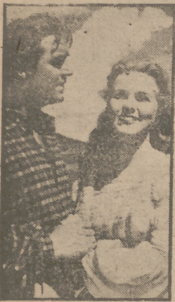
Diana Durbin y Robert Page en una escena de la extraordinaria superproducción en tecnicolor "Feliz y enamorada", obra maestra de la cinematografía moderna...