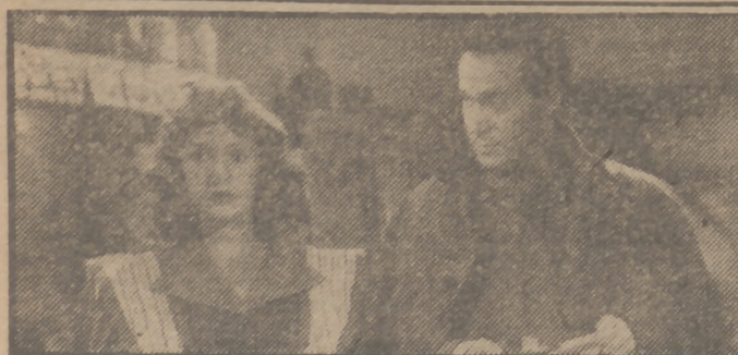
Amparito Rivelles y Antonio Vilar, pareja central de "La calle sin sol", film de gran éxito, que desde hoy, lunes, se proyectará en los cines Paz y Calatravas.

Es una superproducción española, declarada de INTERES NACIONAL, de la acreditada marca Cesáreo González.