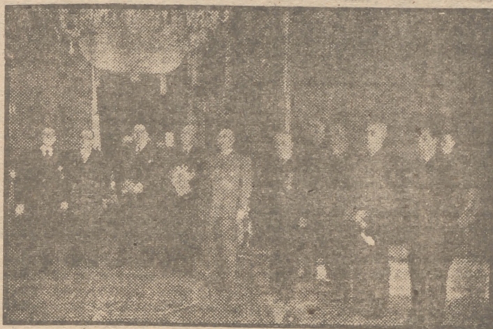
La Junta directora del Instituto de Ingenieros Civiles de España, que ha sido recibida en audiencia por Su Excelencia el Jefe del Estado.

Su Excelencia el Jefe del Estado y Generalísimo de los Ejércitos ha recibido en el palacio del Pardo la siguiente audiencia militar: