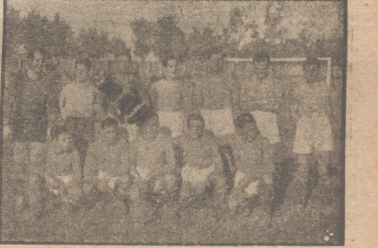
El equipo del Baeza Deportivo de Educación y Descanso, que forma en la primera categoría de la Regional del Sur, 1