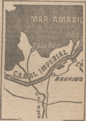
En el gráfico puede apreciarse la estratégica situación de Nankín.