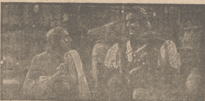
Félix Fernández y Fernando Rey en una escena de "Locura de amor", el mayor éxito del cine español, que sigue cosechando aplausos en el cine Rialto en su octava semana de proyección.

"La Cigarra" es, en suma, aquello que oímos de sugerencias felices al más exigente aficionado, por el esplendor de