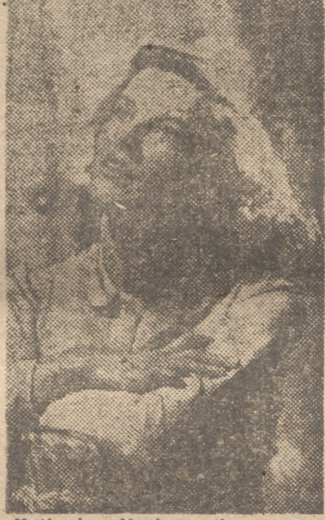
Katherine Hepburn, la excepcional actriz tan admirada de nuestro público, es protagonista de "Mar de hierba", que en breve se estrenará en Madrid.