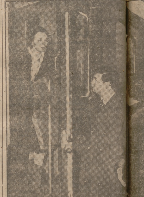
El Rey Miguel de Rumania se despidió de la Ana de Borbón-Parma en la estación de Lausana. A la izquierda del Rey se ve a la Reina Madre, Helena de Rumania. El príncipe Nicolás ha dicho hace unos días que el Gobierno rumano debía el anuncio formal de las relaciones del Rey con la princesa Ana y afirma que los enamorados han sentido en esas relaciones lo que se llama "amor a primera vista", vamos aquí lo decimos "flechazo".