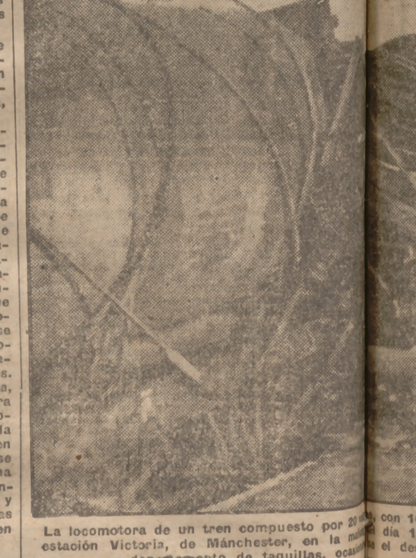
La locomotora de un tren compuesto por 20 vagones, en la estación Victoria, de Manchester, en el departamento de taquillas, ocupando el espacio de 100 metros.