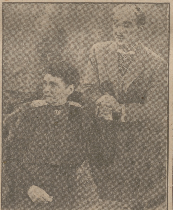
Monsieur Verdoux, amorosamente, convence a sus víctimas. Luego las asesina y roba.

MIENTRAS viajaba camino de Arcachon el bati con su trágico cargamento, una nueva presa se le ofreció a Landrú en la señora Elisa Laporte. Esta mujer tenía bastante dinero, 10.000 libras, y Landrú creyó que valía la pena de convertirse en bigamo para atrapar esa fortuna. La señora Laporte desconfió bastante, mas al fin dejóse convencer por los apasionados argumentos de Landrú y casóse con él en Dijon. Ya en el viaje de bodas aumentaron sus sospechas al registrar la maleta del bigamo y encontrar un estuche forrado en terciopelo azul con tabletas de un veneno muy activo. La señora Laporte huyó a París y contó sus culpas a la Policía. A esta decisión debe el haber salvado la vida. Entretanto, el escurridizo Landrú había desaparecido y se había convertido en un fantasma para los polizontes. Tuvo que abandonar el nido de Rambouillet. Pronto halló otro en el bosque de Rambouillet: un chalet de ladrillo rojo, rodeado de una alta empalizada, sin vecindad indiscreta en las cercanías. Landrú detuvo su coche y examinó el tendador paraje: laureles, rosales... un garaje espacioso y el letrero de "Se alquila".