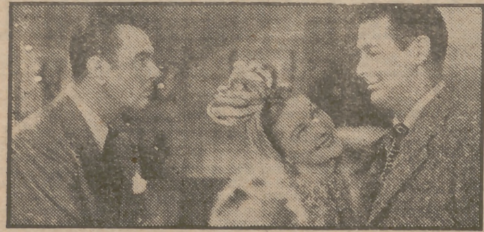
He aquí a la sin par Joan Fontaine entre los apuestos galanes George Brent y Don DeFore en una escena de "Mis cuatro amores", divertido film que muy pronto se estrenará en Madrid Presentado por Mercurio Films.