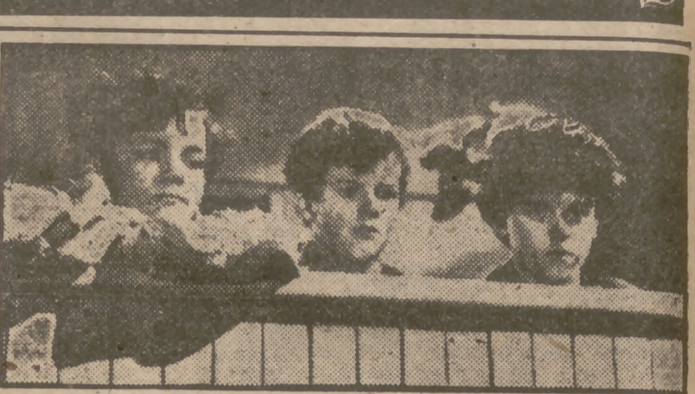
Tomy Kelly, Victor Jory y Jackie Moran en una escena de "Las aventuras de Tom Sawyer", excepcional producción de próximo estreno en Madrid presentada por Cepisa.

Feuillere es algo más que una protagonista de comedias ligeras. De sus personajes, llenos de desenfado y gracia juvenil, al estilo del inolvidable film "Yo he sido una aventurera", sabe pasar a la humanísima y trágica figura que encarnó en "De Mayerling a Sarajevo", sin perder nada de su habitual buen hacer. Su última película, "El idiota", adaptada de la obra de Dostoyevski, nos muestra una nueva Edwige Feuillere, atormentada y violentamente agitada por las pasiones, ternas y coléricas, amorosas y vengativas.