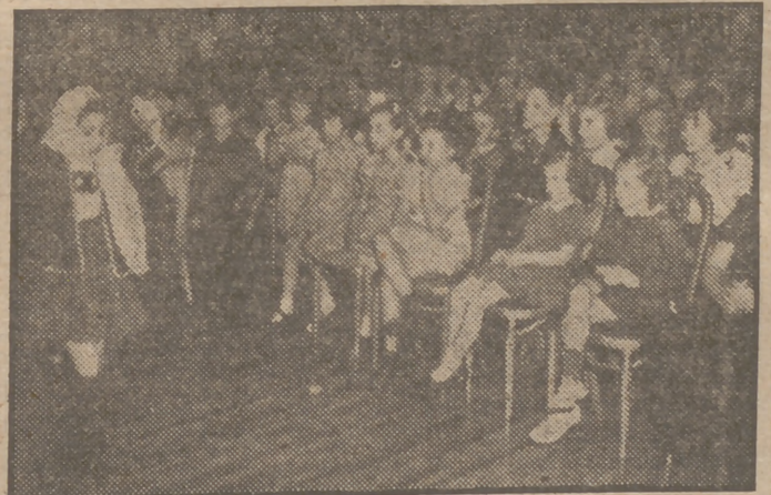
Los niños que pertenecen al personal de las Naciones Unidas asisten a una fiesta navideña en el Belmont Plaza Hotel, de Nueva York, y reciben los regalos que les trae Santa Claus. Ante los pequeños de todos los países representado en las Naciones Unidas contemplan una danza interpretada por una niña siria.