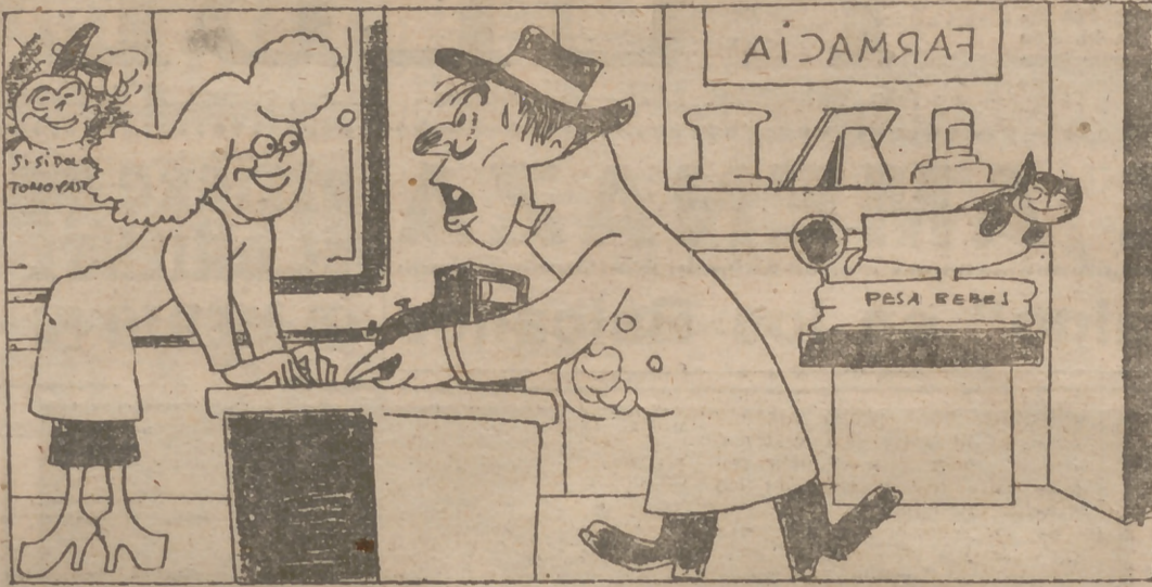
Epílogo de las fiestas pasadas.