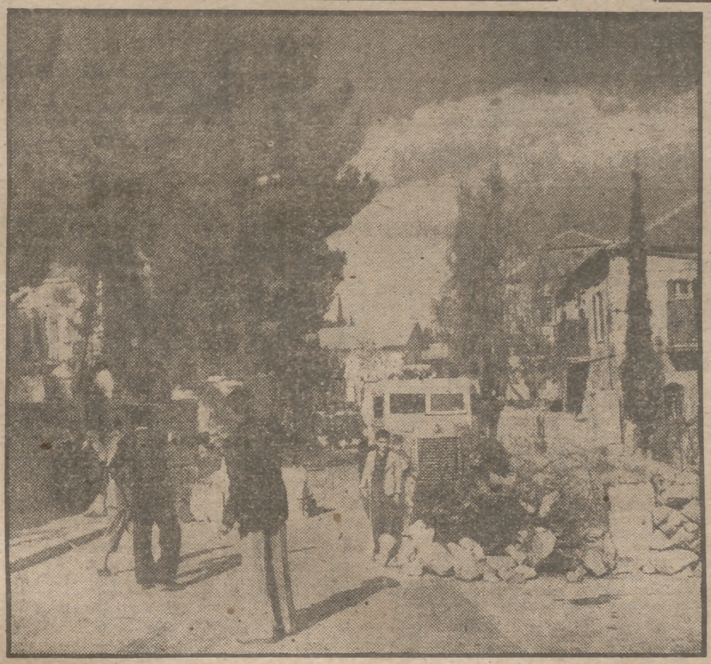
Barricadas en las calles de Damasco. Después del último atentado de los terroristas judíos que mataron a seis árabes e hirieron a dos, la Milicia Ciudadana, creada espontáneamente por los árabes, vigila las entradas y salidas de Damasco, que ofrece ese aspecto bélico de la foto.