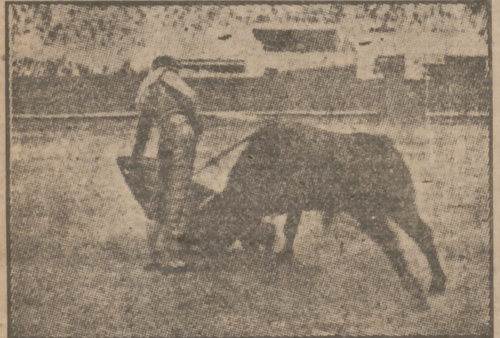
Un natural de Manolete.