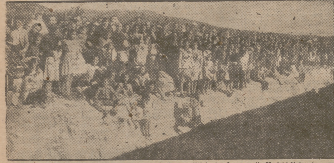
Los habitantes de muchos pueblos del trayecto Cuenca-Utiel, del ferrocarril Madrid-Valencia, se situaron junto a la vía férrea para aclamar al Caudillo a su paso en el primer tren.