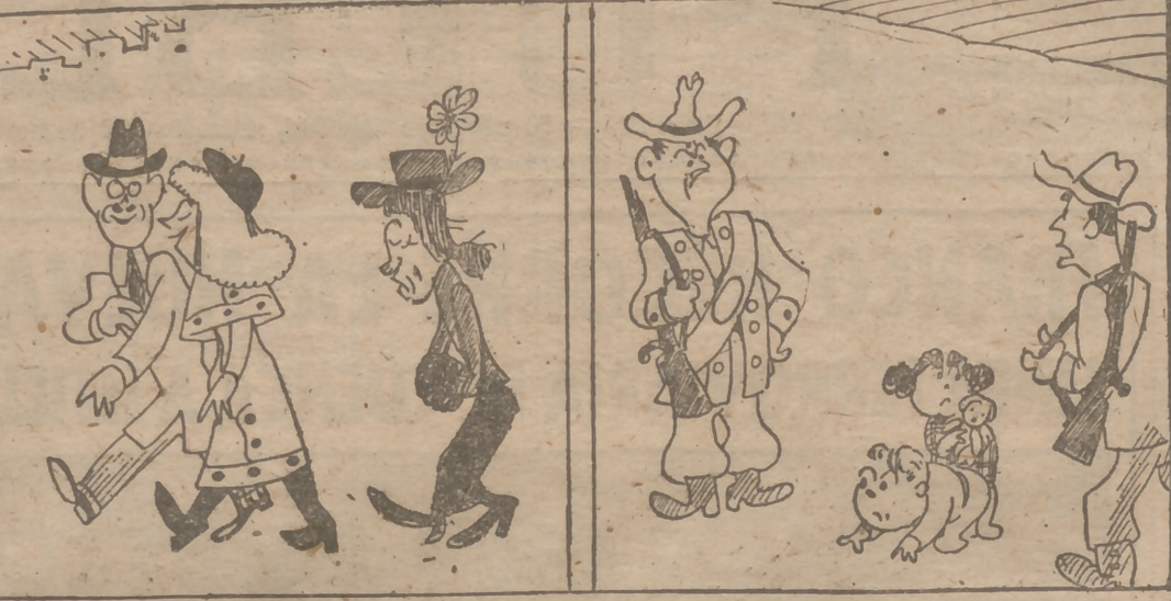
Ayer de las niñas cuidaban las carabinas y hoy día carabinas cuidan de los niños y niñas.