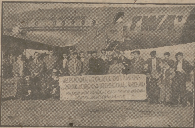
Los delegados de las Congregaciones Marianas de Méjico, en el Congreso Internacional de Barcelona, a su llegada a la capital catalana.