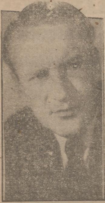
George Sanders, el magnífico actor, protagonista de los films de mayor éxito, lo veremos de nuevo en "El retrato de Dorian Gray", film basado en la célebre novela del mismo título del formidable escritor Oscar Wilde.