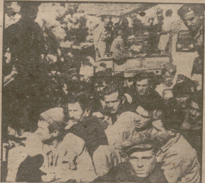
Los guerrilleros de Markos han tropezado con Tsaldaris. En él han encontrado la horma de su zapato. A los convictos y confesos los fusila sin contemplaciones. No coquetea con los comunistas, y a tan enérgica actitud debe Grecia el que no haya pasado a depender de Moscú... el 15 de octubre pasado. Esta fotografía nos muestra a un grupo de guerrilleros hechos prisioneros por las fuerzas del Gobierno durante un combate en Macedonia.

La máscara del cordero.—A estas alturas ya no nos resulta difícil identificar a los lobos comunistas, que para engañar a los incautos—que aún son legión—se cubren con una piel de cordero o se enbarban las patas, como el lobo de cuento. Markos, bajo su travestido "apariencia de patriota, pertenece a la promoción de los Thores, los Dimitrov, los Tito y demás agitadores soviéticos. El mismo declaró que le sostiene en su lucha el Comité Nacional Democrático Heleno. Bien. En esta serie de reportajes que venimos publicando sobre el este de Europa hemos mencionado más de una vez al citado Comité, cuya misión consiste en reclutar y adiestrar a los voluntarios de las Brigadas Internacionales que van a luchar en la general Markos en las montañas y cuya sede se encuentra—se encontraba hasta hace poco—en Belgrado, pasando a depender últimamente de una de las secciones del Komintern.