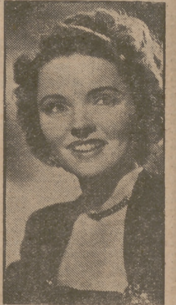
Jane Wyatt, quien está dispuesta a escalar la cumbre más alta en la carrera cinematográfica.

Jane, un producto del Bernard College y miss Chapin's School, llegó aquí hace once años, procedente de los escenarios de Nueva York, para hacer "One More River", con Diana Wynard, para la Universal. Luego regresó a Nueva York y figuró como la protagonista de "Horizontes perdidos", una obra que no debe confundirse con la película "El horizonte perdido", que la misma Jane hizo después con Ronald Colman. La obra teatral es de Harry Segall, el mismo autor de "Mr. Jordan". La película está basada en el libro de su mismo nombre, de James Hilton. Jane desearía no haber trabajado en ella, porque esta película no tuvo éxito. "Y nunca hace bien aparecer en películas malas", dice ella.