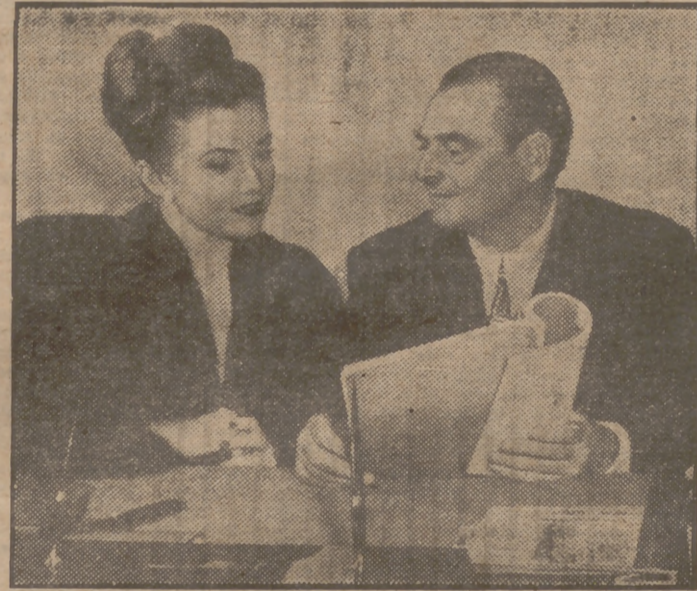
El productor Bryan Foy con una de sus estrellas, la bella Joan Leslie.