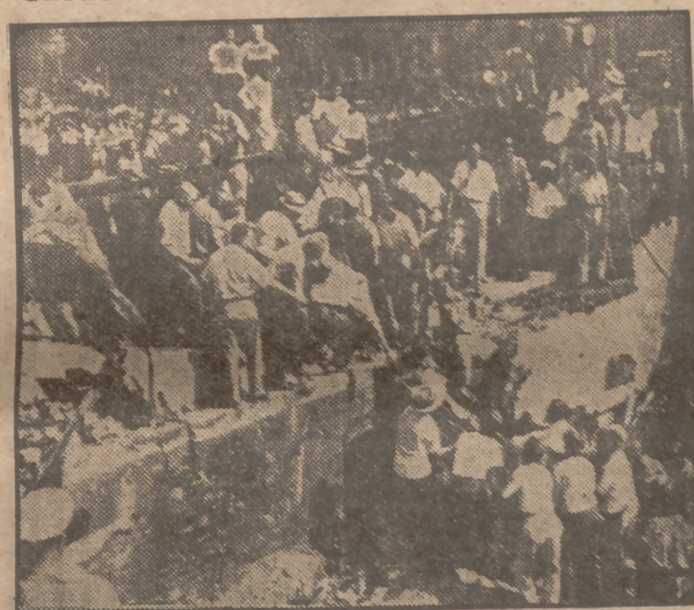
En Harrinburgo (Estados Unidos) se produjo recientemente una explosión en una sala de belleza que costó la vida a nueve personas y más de 50 heridos. La explosión, cuyas causas aún no han sido precisadas, destruyó toda la planta. La fotografía recoge el momento de extraer una de las víctimas de entre los escombros.