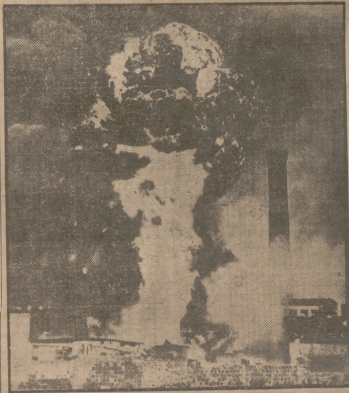
En una importante fábrica de jabón de Montreal (Canadá) se declaró un gran incendio. Enormes cantidades de productos destinados a la fabricación arrieron, originando espesas nubes de humo, que en ciertos momentos tomaron la forma del hongo atómico de las experiencias de Bikini.