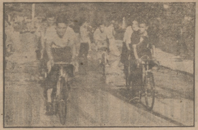
El equipo belga se dirige por las calles madrileñas al lugar designado para el preajuste de sus máquinas.

Mañana, domingo, se irá de Pamplona a Tolosa, y el lunes se cubrirá la etapa Tolosa-Bibao.