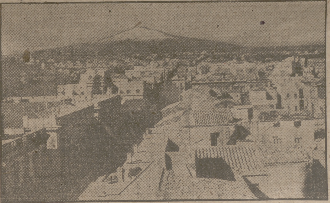
Desde la ciudad de Catania el Etna presentaba este aspecto en la última fase de su reciente erupción. La lava no brotó del cráter más alto, sino de otro secundario en la vertiente derecha.