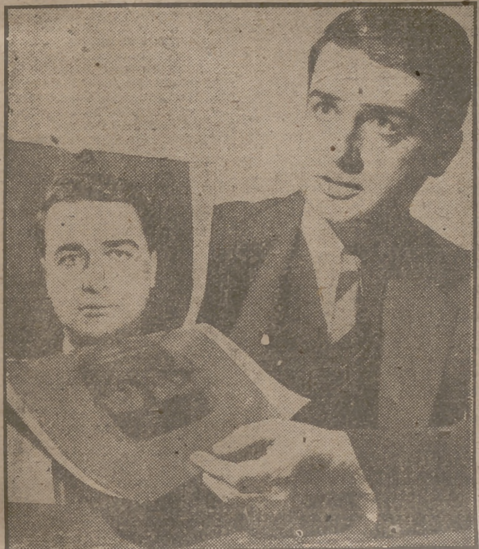
Edwin H. Land ha hecho una demostración en Nueva York de su último invento. Un dispositivo especial en una máquina fotográfica de estudio permite obtener una positiva de un retrato en el plazo de un minuto.