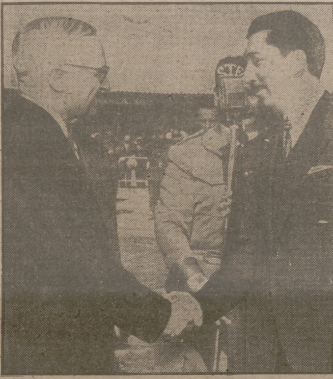
Truman y Alemán, Presidentes de Estados Unidos y México, estrechan sus manos poco después de la llegada del primero al aeropuerto de Méjico. Durante tres días Truman fué huésped de honor de la capital azteca.