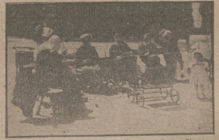
Hoy se solearon a sus anchas los niños en el Retiro. Sin embargo, el tiempo no está muy seguro. Pero hay que aprovechar con ansia, después del largo periodo de lluvias padecido, los momentos en que el padre Febo hace su aparición para bien de los peques y de sus chachas.