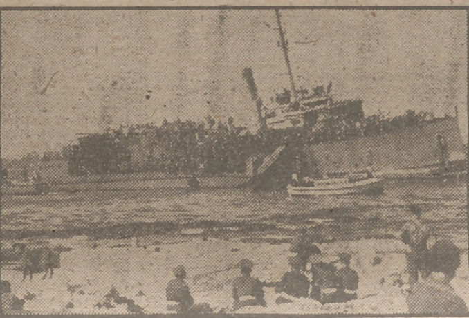
Inmigrantes ilegales Judíos echaron por la borda a una pequeña dotación inglesa del "Haim Arlosoroff", y con nueva tripulación pretendieron desembarcar en Haifa. Desde la playa el servicio de vigilancia está presto a impedir la fuga.