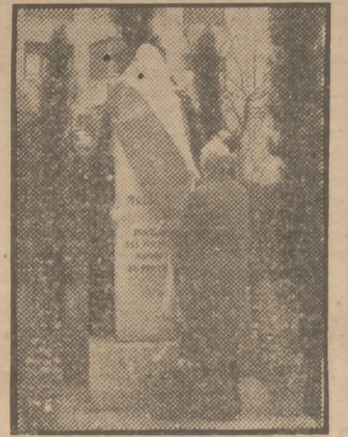
El marqués de Guad-el-Jelú ha descubierto en Barcelona el monumento a don José Maluquer, fundador del Instituto Nacional de Previsión.

Se ha acordado en firme la apertura de la estación telegráfica.