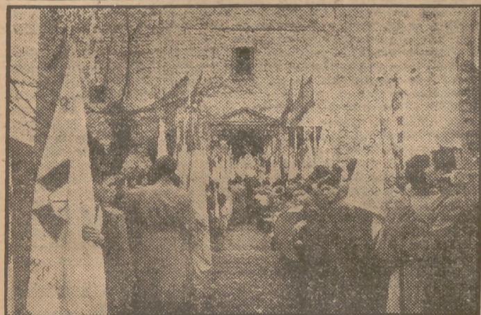
Un aspecto de la peregrinación de los jóvenes de Acción Católica de Madrid-Alcalá al santuario de Nuestra Señora de la Victoria, en Villarejo de Salvanés.