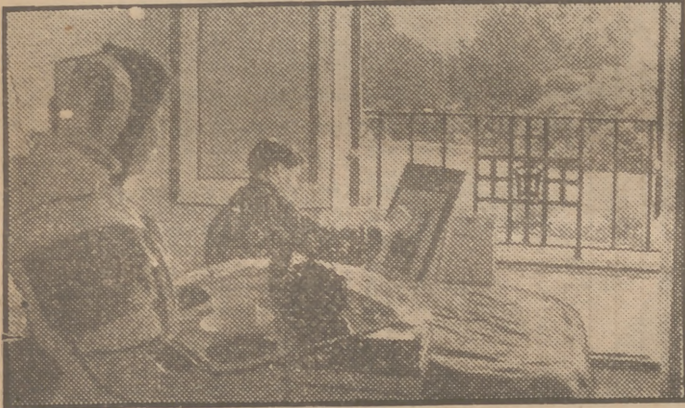
Cerca de la ventana que se abre sobre el jardín el enfermo copia del natural. Si su estado es débil, no se le consenten "temas" de colores fuertes. Si se halla fuerte, los colores fuertes ayudan a su mejoría.

H AY muchos procedimientos para curar las enfermedades, por lo menos tantos como para no curarlas, sin que contemos entre ellos el de llamar al médico, medida desesperada que sólo debe adoptarse en caso de desahucio. La verdad es que desde la aparición de la psicoanálisis han surgido otros sistemas que no se apoyan precisamente en la farmacopea para restaurar la salud averiada o perdida. Claro que muy anterior a Freud es, vórbica, el mesmerismo, nacido al amparo de una charlatanería elegante, allá en los finales del siglo XVIII. Pero de la cubeta mágica de Mesmer al minucioso interrogatorio de los freudianos no hay tanta distancia: en todo caso, la que pone por medio la benévola inclinación del lector a dejarse sugestionar.