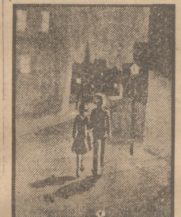
Escena callejera, obra de Miss Blair Oliphant, pupila en el sanatorio de Adrián Hill.

parece quien a los dos meses de ensayos no se declara cautivado por su ocupación. Certo que muchos pierden el interés por el arte apenas se incorporan a la vida ordinaria, pero otros descubren dentro de sí unas aptitudes que sobreviven en los años posteriores.