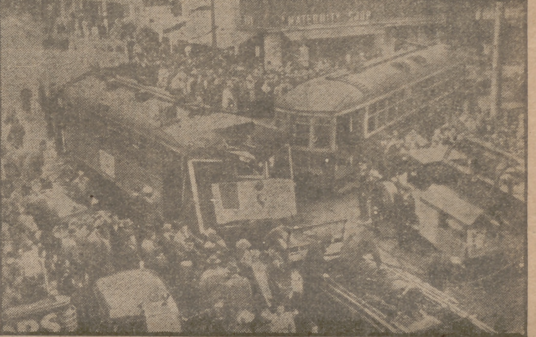
En San Francisco se produjo un choque de tranvías, que ocasionó un muerto y once heridos. El muerto era un peatón, que resultó cogido entre los dos vehículos.