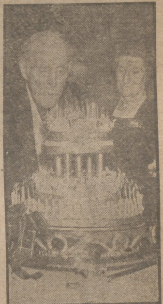
El más viejo soldado británico, general sir Ian Hamilton, celebra su noventa y cinco cumpleaños. Y en la fotografía se ve al general soplar la tarta monumental para apagar las 95 velas de que se compone, con arreglo a la tradición.