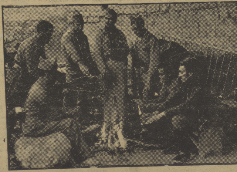
En las avanzadas de Casetas, a dos kilómetros de Huesca, los milicianos del P.O.U.M., calentándose junto al fuego. —En el frente hace frío. Envían mantas, jerseys, abrigos, lanas al Socorro Rojo del P.O.U.M., Pelayo, 62. (Foto Centelles).

Los camaradas de las organizaciones obreras, deberían precaverse contra esa ligera dosis de opio que ingieren inconscientemente, al compartir su responsabilidad, con los restos representativos de una pseudo-democracia ya difunta. Ellos, como supremos y únicos representantes de las masas campesinas y obreras, deben asumir, en exclusiva, su dirección y barrer, si es preciso, de los puestos de mando, a los que contra viento y marea, no tienen otra misión que frenar el ímpetu revolucionario. Al timón de esta motonave gigante, no pueden ir pilotos de cuota, ni capitanes vitalicios de los que cada día se avienen a un cambio de ruta. Timoneles de mano dura, serena, sereno y templado acerao necesita, si no queremos que vaya a la deriva. G. VERDEJO