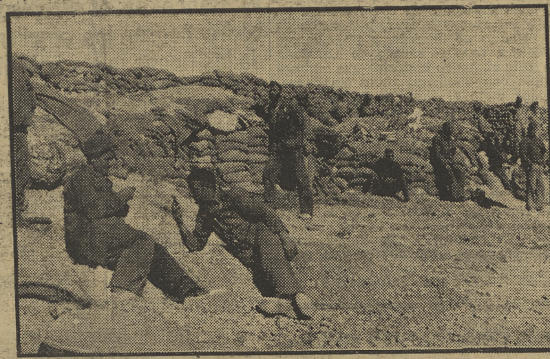
Nuestros milicianos que están en la Sierra de Alcubierre, han construido, para fortificarse, trincheras y cuevas para preservarse de las lluvias y de los aviones enemigos.

dos puede adquirir más importancia numérica cada día, y hay que abordar el problema no de una manera improvisada y resolviendo precipitadamente, sino desarrollando todo un plan estructurado. Nosotros creemos que una medida acertada sería el nombramiento de una Comisión especial dedicada exclusivamente a la cuestión de la distribución y organización de los refugiados.