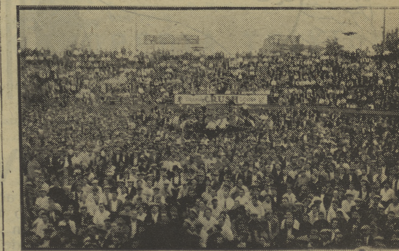
Cuatro aspectos del grandioso mitin de «rabassaires» celebrado el domingo último en Lérida. En las fotos puede verse el genio que escucha la voz de nuestros camaradas Nin y Palacin