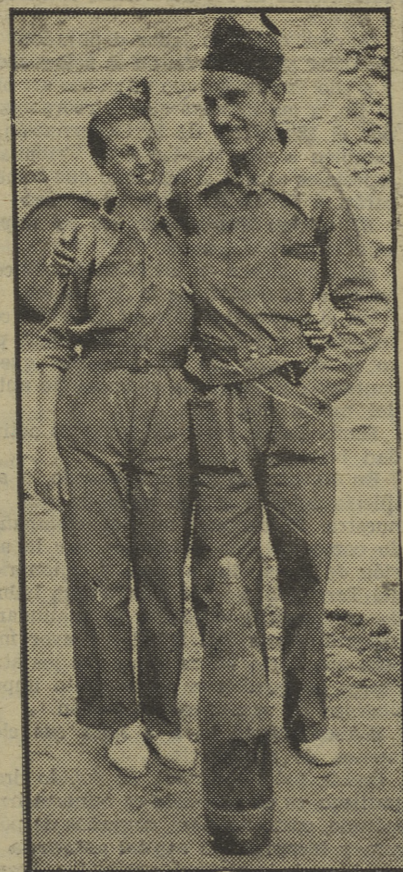
Una feliz pareja, recién «bendecida» en el frente