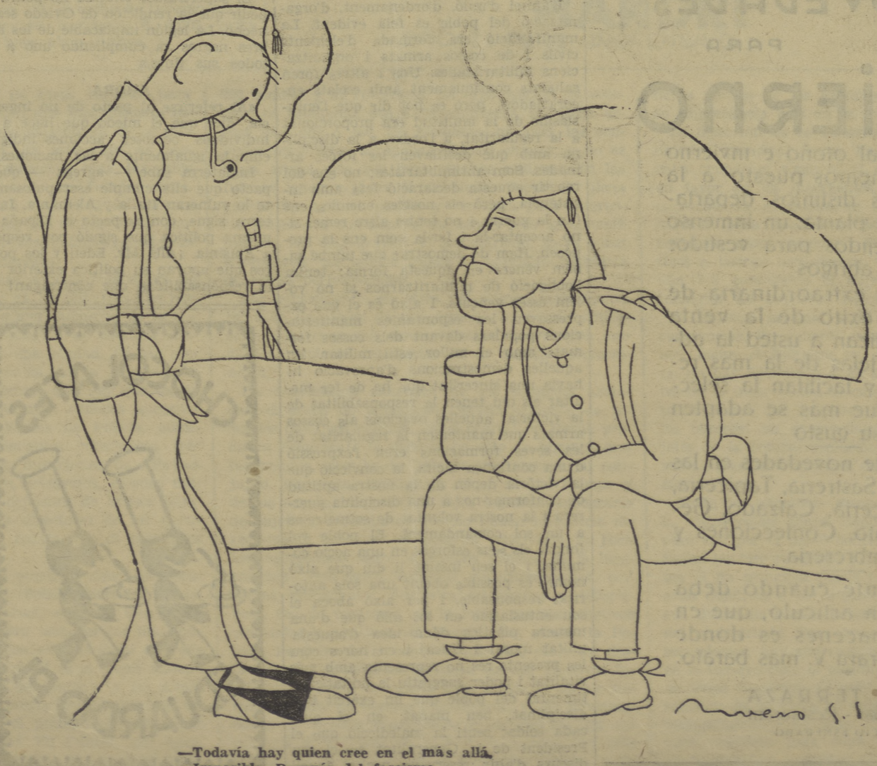
—Todavía hay quien cree en el más allá. —Imposible. Después del fascismo. (Viene de la pag. 7)