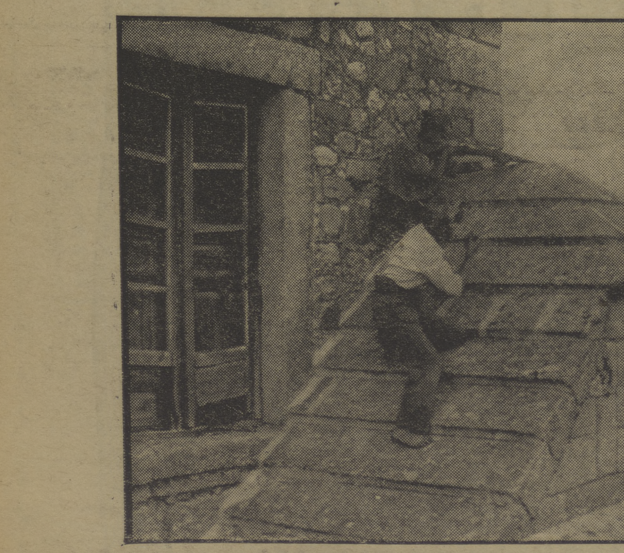
Los luchadores obreros aprovechan todas las coyunturas para batir con la máxima eficacia al enemigo desde los tejados de las torrecillas del viejo castillo