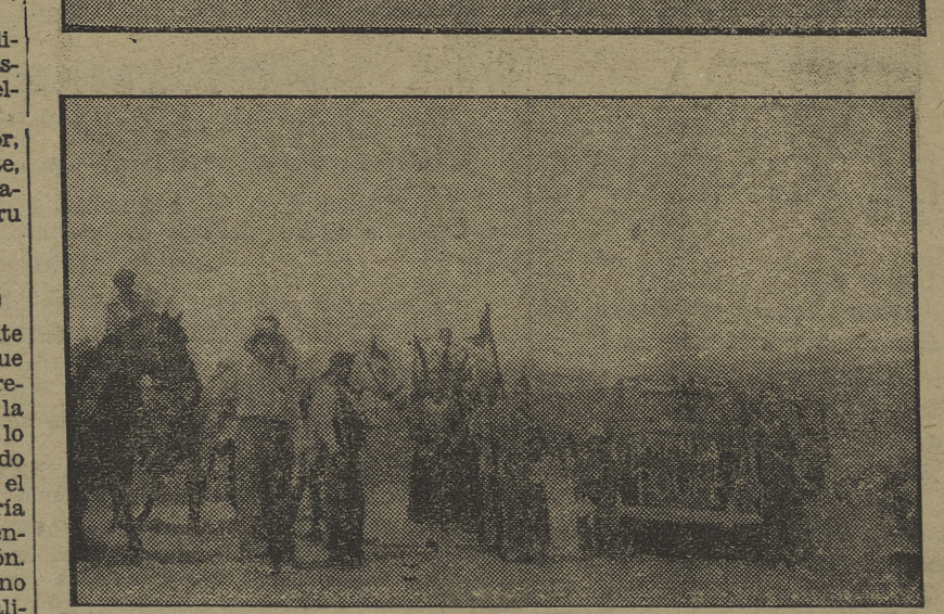
Autos y camiones de la columna motorizada del P. O. U. M., de Madrid, que opera en Sigüenza, hacen un alto en el camino hacia la línea de fuego