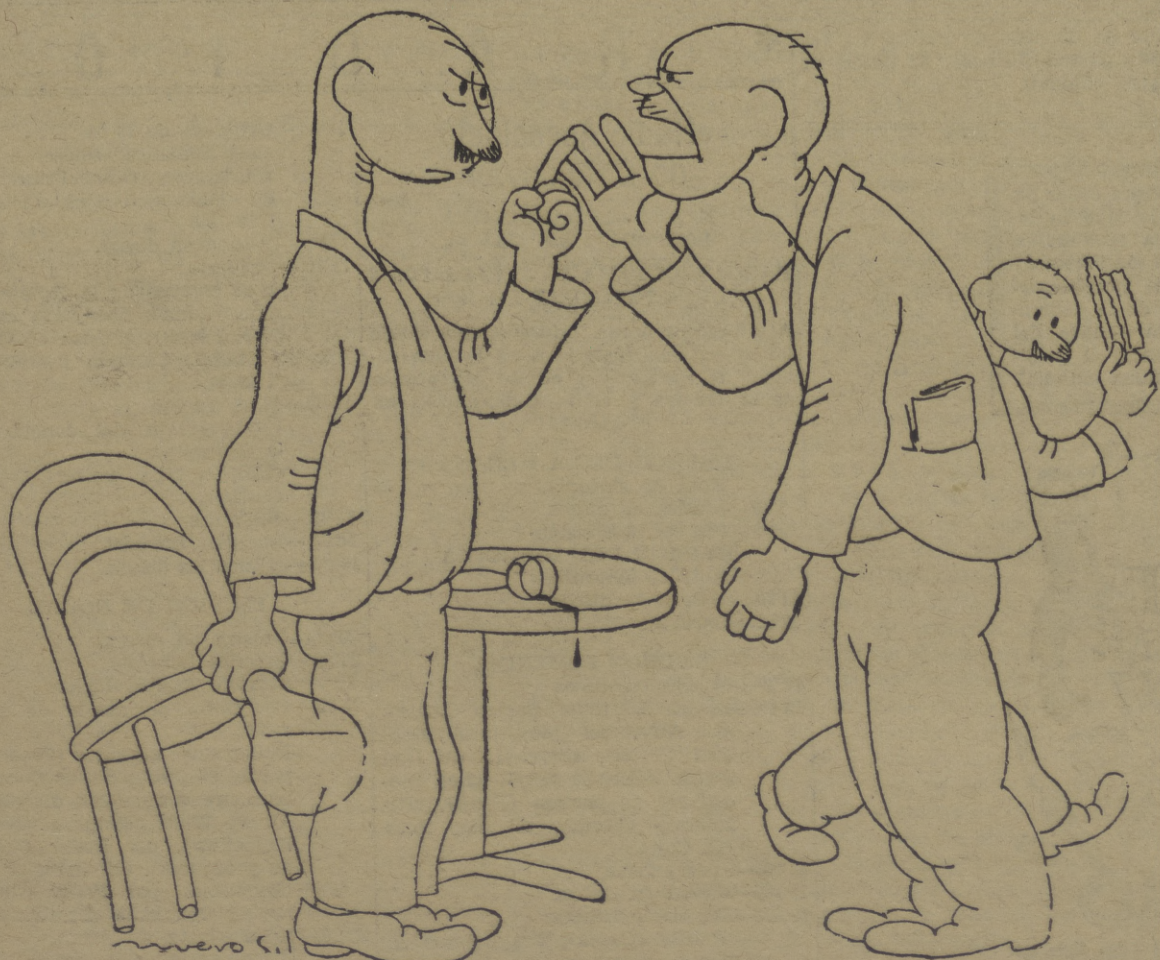
AUN HAY CLASES

Tercero.—Con cargo a las consignaciones mencionadas los consejeros titulares de cada Departamento contribuirán al Departamento de Finanzas la aprobación de las facturas a satisfacer, o bien dictarán las órdenes de pago correspondientes a los compromisos que hayan adquirido para atender las especiales necesidades del momento.