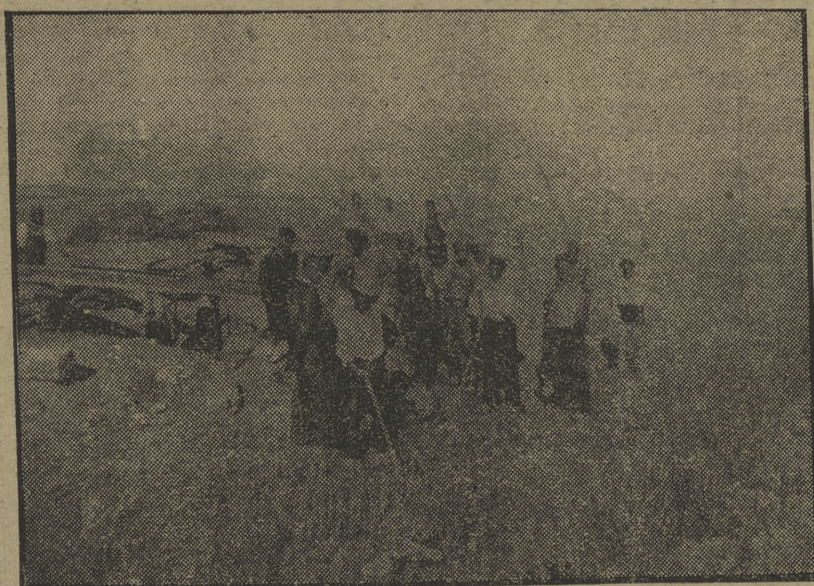
Un grupo de obreros del campo aragonés en franca camaradería con los milicianos de nuestra batería

Cruzando tierra aragonesa nuestra batería era continuamente aclamada en los pueblos de su paso con el grito de ¡Viva el P. O. U. M. y la Juventud comunista Ibérica!