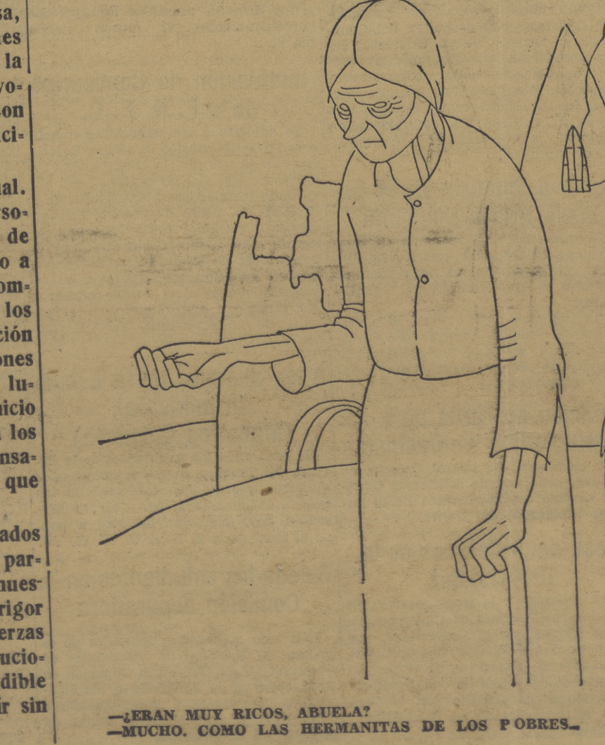
—ERAN MUY RICOS, ABUELA? —MUCHO. COMO LAS HERMANITAS DE LOS POBRES.

Con este título, el «New Leader», de Londres, publica el siguiente suelto: «El único sitio donde ha habido una reunión realmente representativa...»