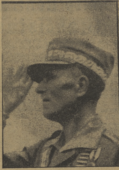
MILLAN ASTRAY. El jefe de los Legionarios Extranjeros.