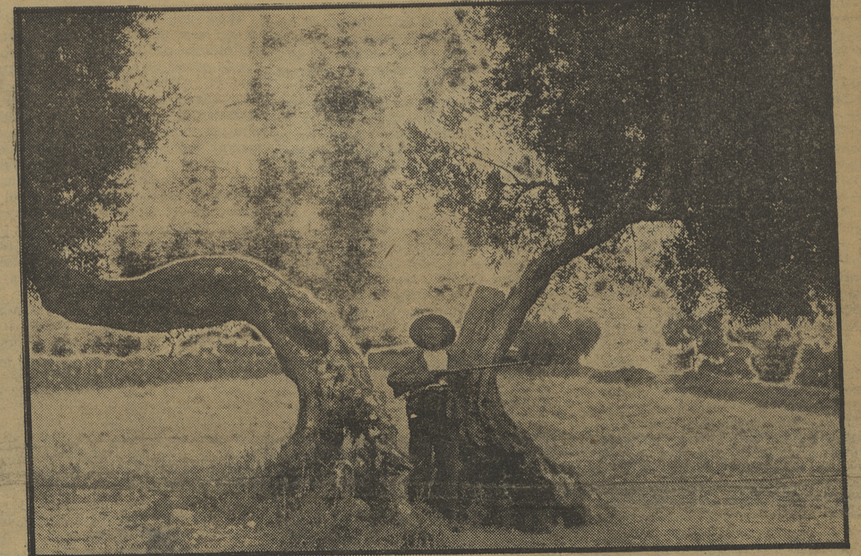
Un viejo y bravo miliciano en los campos aragoneses

del Buró Internacional esta semana, ha sido en el Ejército obrero que opera en el frente de Zaragoza contra el fascismo.»