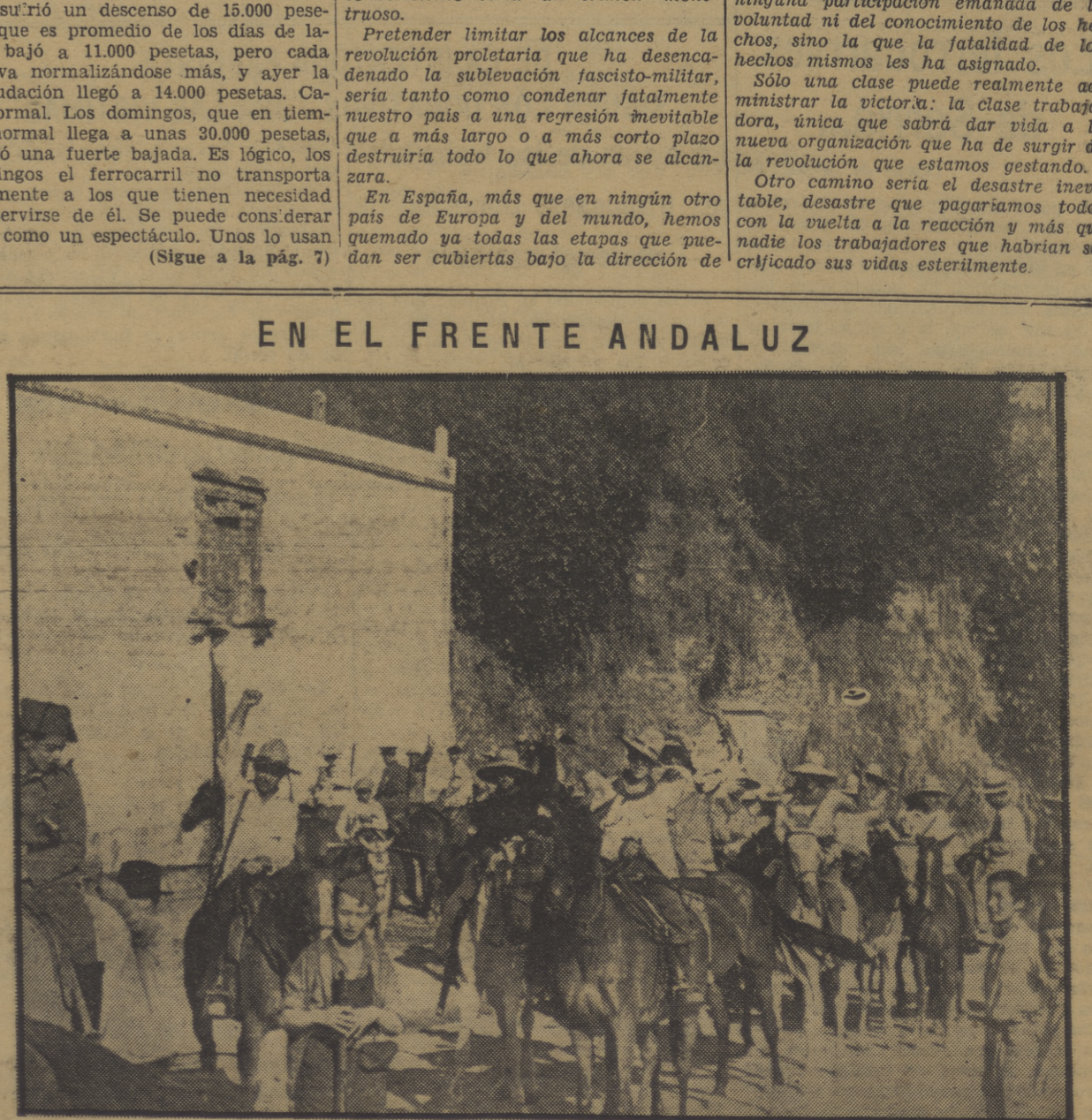
Columna de campesinos a caballo, de Montoro, que sale hacia el frente