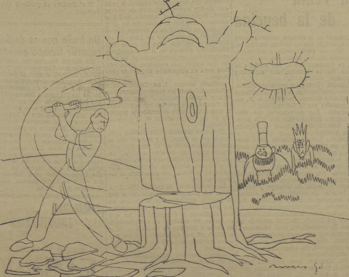
—AHORA, EL TRONCO. DESPUES LAS RAICES.—