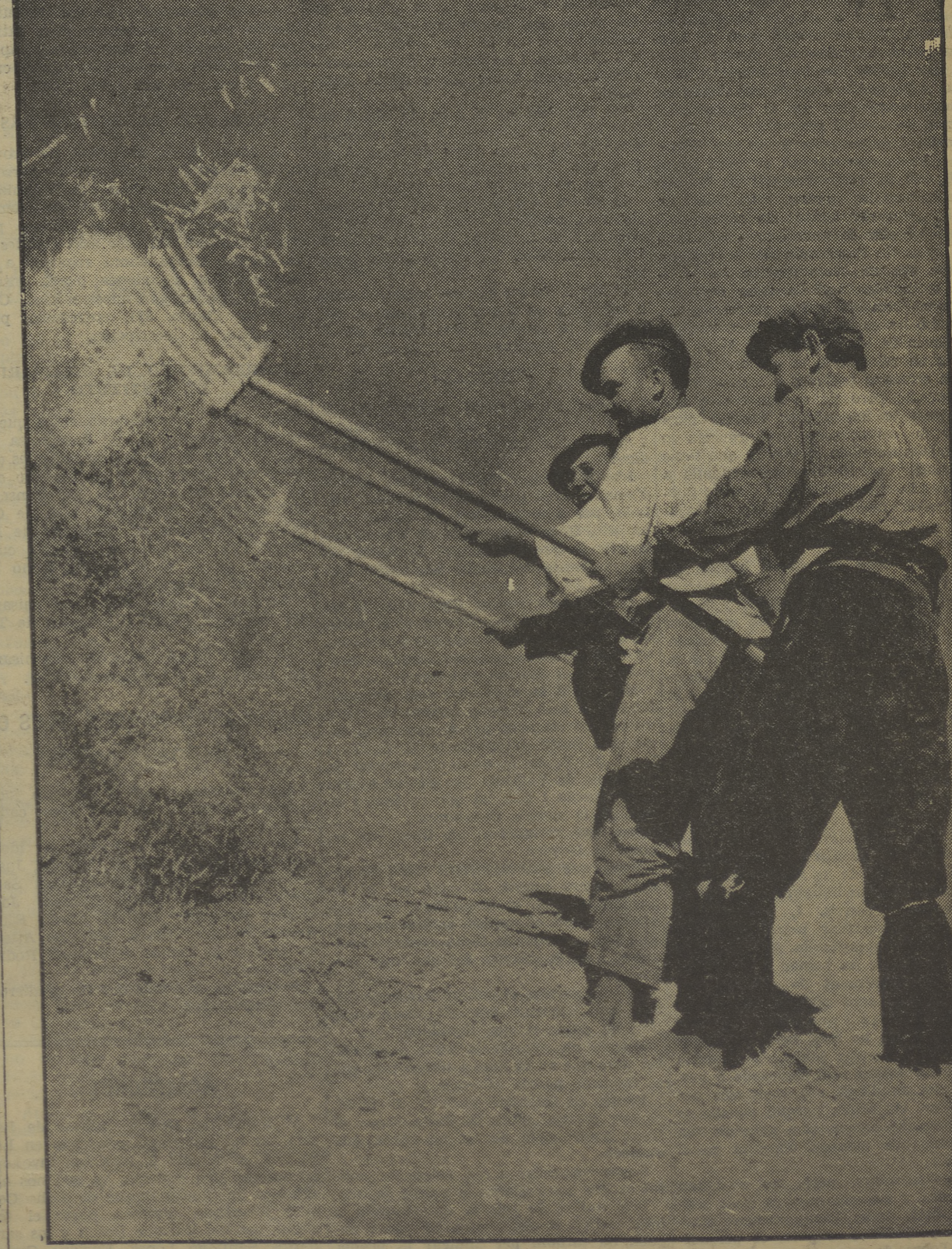
Los campesinos de Cataluña aventan, alegres, el trigo, sabiendo que ya no irá a llenar los graneros de los grandes terratenientes.

HOY El gran traidor A Gil Robles se le ha llamado estos días el gran traidor. Produce verdadera indignación tanta injusticia. Porque es una injusticia, una arbitrariedad, una falsedad, llamar a Gil Robles traidor. ¿A quién ha traicionado Gil Robles? ¿A la República? No; Gil Robles no ha sido nunca republicano. No ha engañado a nadie a este respecto. ¿A la clase trabajadora? Menos. Por eso produce extrañeza la acusación de traidor que le lanzan los periódicos republicanos y los periódicos obreros de Madrid. Nosotros creemos todo lo contrario: que la traición se esboza en quienes acusan a Gil Robles de traidor. ¿Habían puesto acaso alguna confianza en él? ¿Habían creído que procedería de otra manera que como ha procedido? ¿Y qué decir de la acusación similar que se lanza contra los generales fascistas? ¿Puede decirse seriamente que han traicionado Goded, Franco, Fanjul y demás sublevados? No. Han hecho lo que era natural y lógico que hicieran. ¿No eran reaccionarios? ¿No eran fascistas? Pues han procedido como tales. Quienes no han procedido como debían son los gobernantes republicanos y sus seguidores del Frente Popular. Si hubieran aplastado políticamente a Gil Robles, destruido económicamente a March, retrado a todos los oficiales reaccionarios del Ejército, no hubiera sucedido nada de lo que ahora lamentan. Hay una manera de no aparecer como ladrón. Es acusando de ladrones a los otros.