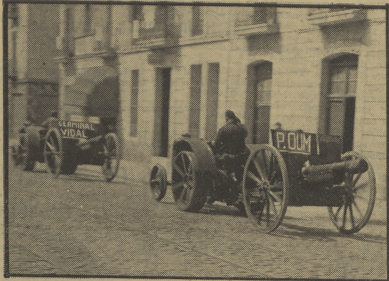
La batería que lleva el nombre de nuestro heroico camarada atraviesa las calles de nuestra ciudad, camino del frente. (Exclusiva para LA BATALLA)