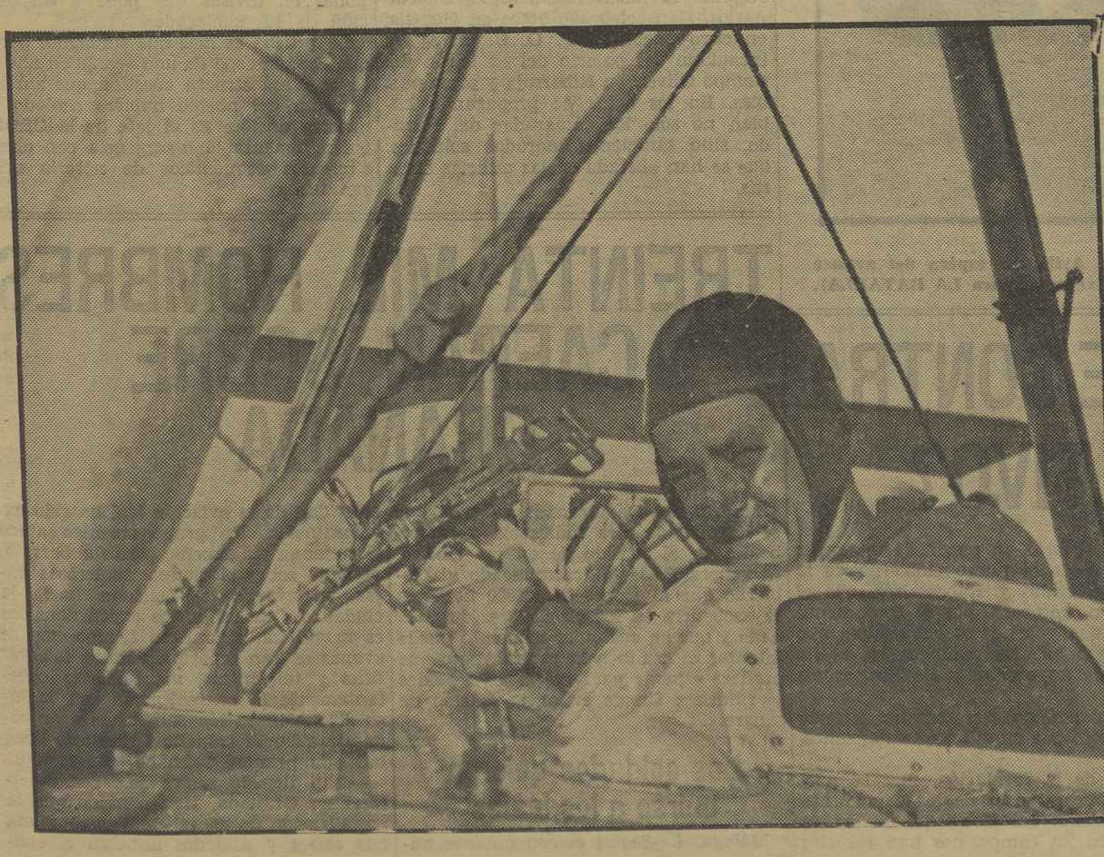
Se arrojaron, también, periódicos desde el avión, que explicarán a los habitantes de Mallorca la verdadera situación.

«También de su ministerio? —De mi ministerio ya he salido de todo en la «Gaceta» por decreto, pero hay muchas órdenes de lista o importancia que aquella, que no se ha dado a conocer.