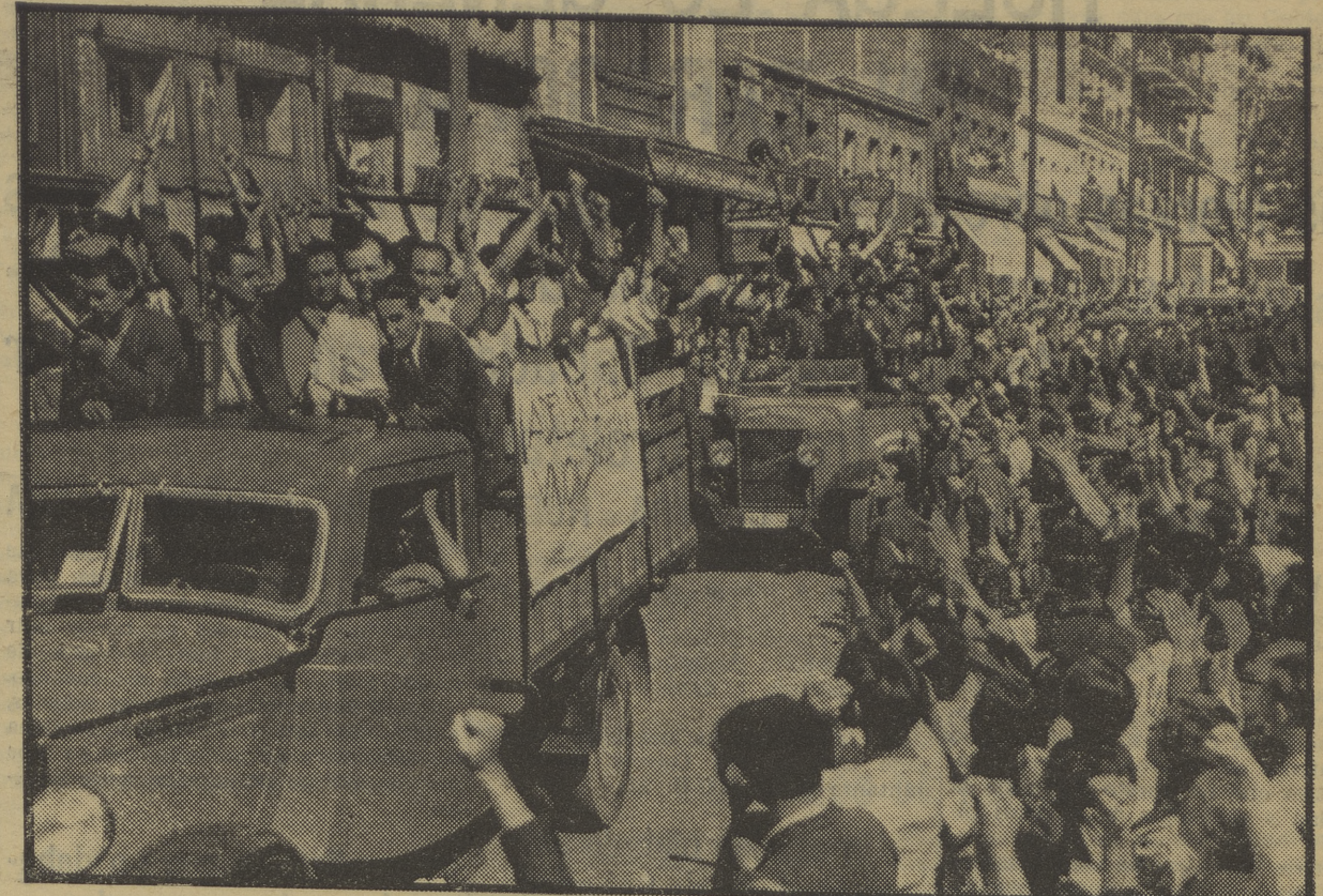
A su paso por las calles madrileñas, los milicianos que marchan al frente reciben el homenaje entusiasta del pueblo.