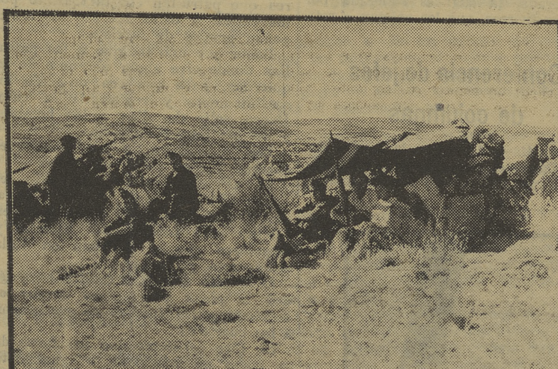
Las avanzadillas descansan a las puertas de Avila, en espera del avance inmediato. (Exclusiva para LA BATALLA)