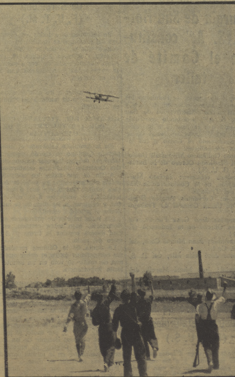
Al paso de los aviones leales, los milicianos de las avanzadillas levantan el puño en un saludo fraternal. (Exclusiva para LA BATALLA.)

¡Incautación de la tierra y reparto entre los campesinos pobres!