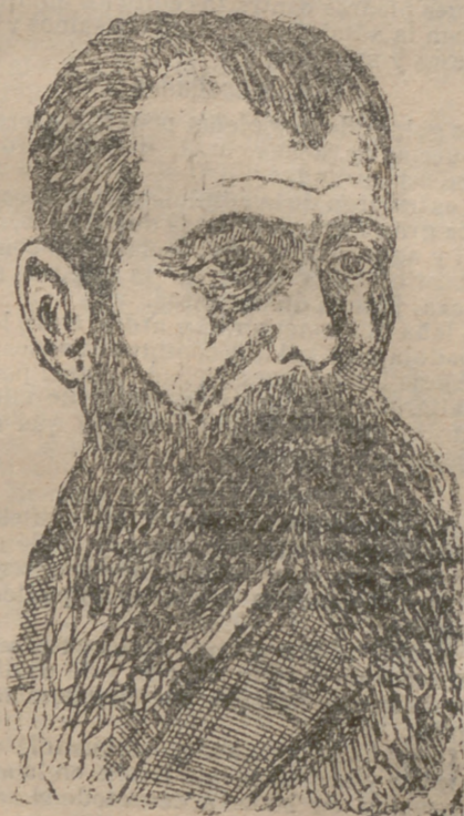
EL CAPITAN DEL MONSERRAT.