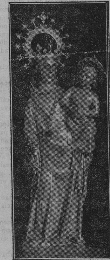
Santuario e imagen de Nuestra Señora del Puig de l'ollensa.