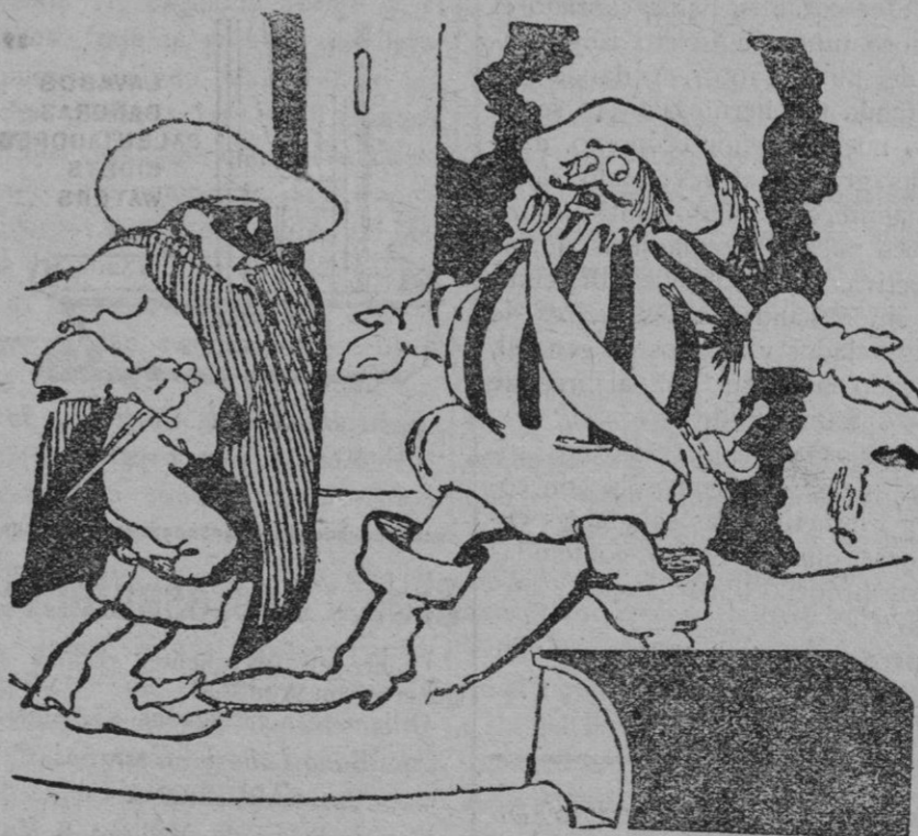
El actor (en voz baja a su compañero).—¡Mátame sin preguntarme nada, que no me acuerdo del papel!

Como tantos otros veranos, y éste al parecer con preferencia, pretendiendo aprovechar ausencia obligada del Rey y del jefe del Gobierno, que van a cumplir sus altos deberes inaugurando el ferrocarril de Canfranc, con cuyo motivo España recibirá nuevos testimonios de estimación mundial, se maquinaba para promover una algarada, sobre cuya pista están ya las Autoridades; pero el medio más eficaz de abortarla es la actuación ciudadana, la conminación, la repulsa y aun el castigo ejemplar, impuesto por cuantos teniendo por divisa la lealtad, y por misión velar por el orden público, emprendiendo el alcance de sus deberes, obren por sí mismos energicamente y repriman, con mano dura, la mera proposición de que falten a ellos tratando de mezclarlos en maniobras infamantes para el buen nombre de España. Toda jerarquía se pierde cuando se traiciona el deber y la única que subsiste es la que mantiene su estricto cumplimiento."