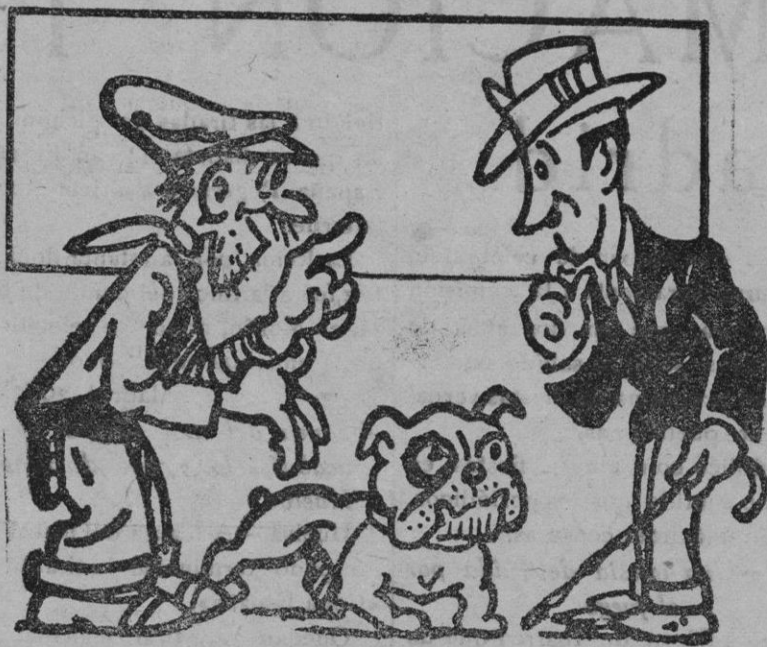
El amigo del hombre

Otra visita interesante: la Exposición de Avicultura. ¡Como abrían los ojos y tomaban notas los que en casa se cuidan de las aves y conejos! Y ¡qué alegrón para todos al saber que nuestra pareja de pavos reales estaba premiada! El Presidente señor