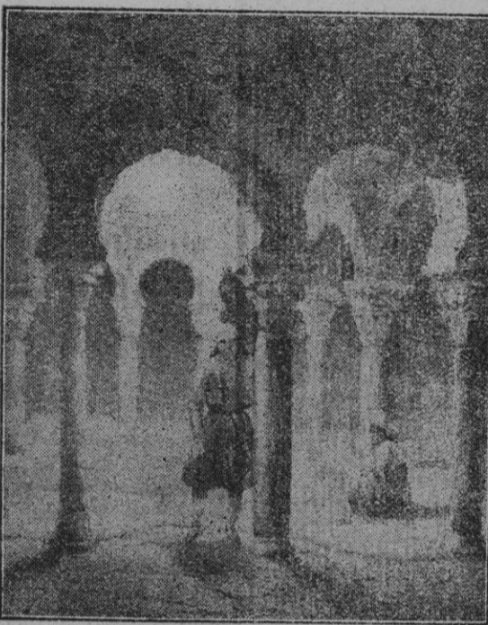
Del libro Souvenirs d'un voyage d'art à l'île de Majorque , por J. B. Laurens (1840). Baños árabes existentes en la calle de Serra.