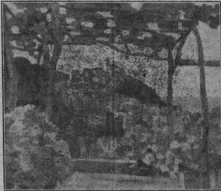
Bello cuadro que forma parte de la colección de emparrados pintados por el reputado pincel de Antonio Gelabert. Al fondo, el pintoresco pueblo de Deyá.