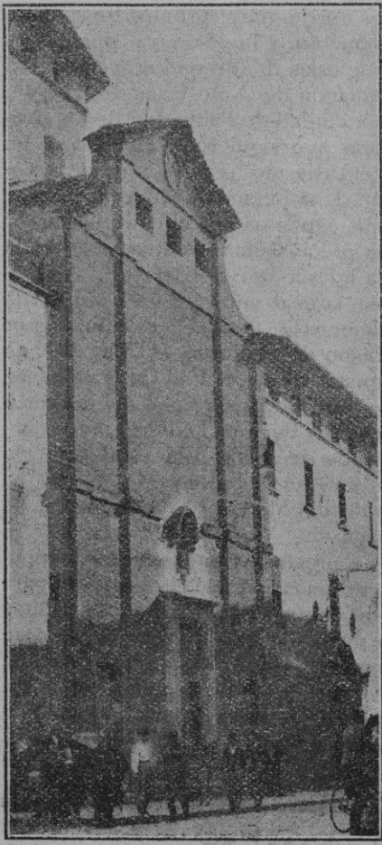
Iglesia de San Antonio de Viana, frente a la cual se ha celebrado hoy la tradicional bendición de caballerías.

Eso del baño de mar el día de Navidad sí que dejaría aturridos a nuestros sesudos abuelos, que consideraban como un deber ritual no zambullirse en los clásicos baños de la Portella sin el debido permiso del veraniego San Cristóbal. Aun sus descendientes no osamos remojarnos si junio no está adelantado; pero para un inglés acostumbrado al bajo cero y a la perenne neblina de su país, debe ser lo más natural del mundo, si el termómetro pasa de los quince, y el cielo está radiante, bajar a Cala Major, y meterse gozosamente en el agua aunque deje boquiabiertos a los atónitos transeuntes, que contarán el episodio como cosa de sueños.