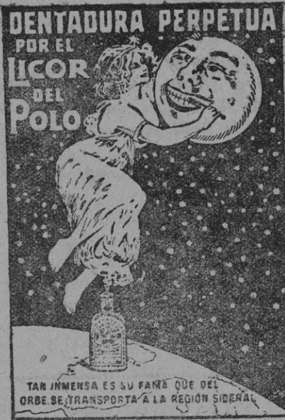
TAN INMENSE ES SU PAÑO QUE DEL ORBE SE TRANSPORTA A LA REGION SIBERIAL.