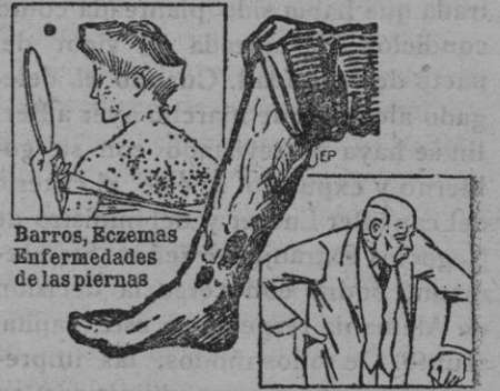
Barros, Eczemas Enfermedades de las piernas