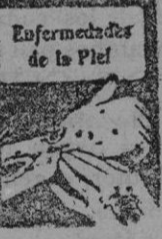
Enfermedades de la Piel

Cada frasco va acompañado de un folleto ilustrado. De venta en todas las buenas farmacias y droguerías. Laboratorio L. RICHELET, de Sedán, 6, Rue de Belfort, Bayonne (Francia)