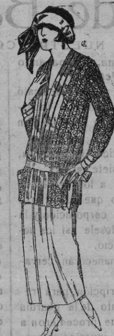
Palcos de punto de seda, dibujos novedad de ptas. 90