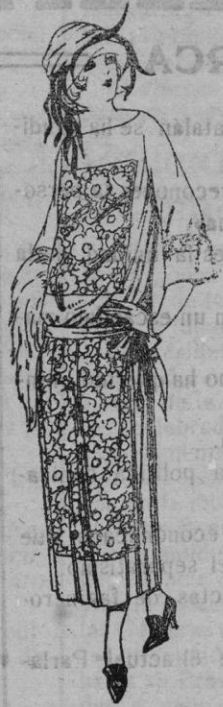
Vestidos de popeline, crespón, etc. en negro, azul y color, adornos bordados de ptas. 130