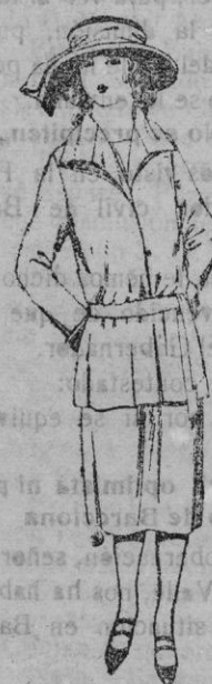
Trajes sastre, de gabardina, sarga inglesa, etc., en azul y color, para jovencitas de 13 a 15 años de ptas. 75