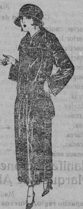
Abrigos de gabardina inglesa impermeabilizada, en negro, azul y color de ptas. 130

Precio fijo Ventas al contado Pídase el catálogo general