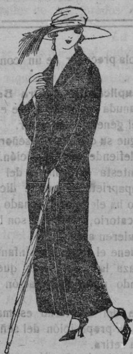
Trajes sastre, de sarga inglesa, popeline, etc. adornos bordados, chaqueta forrada de seda, en negro, azul y colores moda de ptas. 120 a 135

Madrid, Barcelona, Alicante, Almería, Bilbao, Cádiz. Cartagena, Gijón, Granada, Santander, Sevilla, Málaga, Valencia, Valladolid, Zaragoza