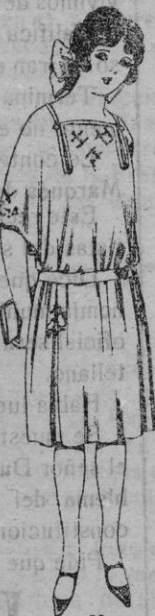
Vestidos de popeline, estambre, etc., en azul y colores moda, adornos bordados, para jovencitas de 13 a 15 años de ptas. 60