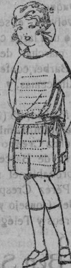
Vestidos voile, adornos calañes de 4 a 9 años de ptas. 15 a 18

Gorras, Sombreros, Cinturones, Calzetines, Corbatas, Pañuelos, Fajas, Ligas, Tirantes, etc., etc.