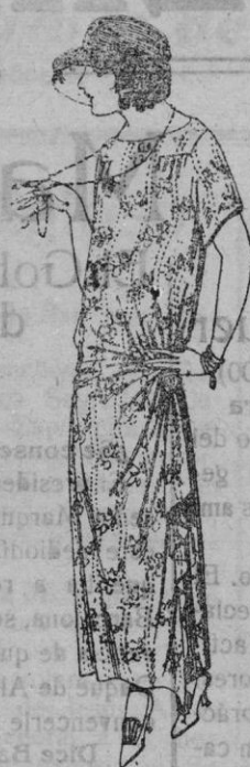
Vestidos de voile, dibujos moda, adornos plizados, broches fantasía de ptas. 62