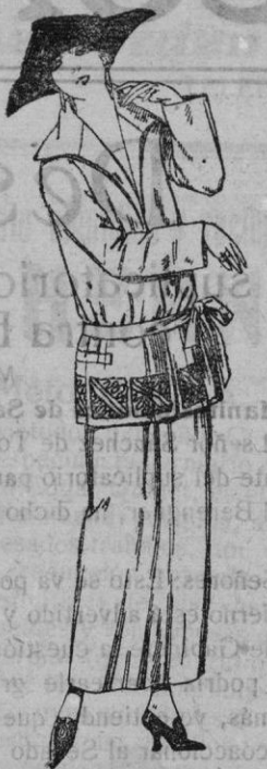
Trajes sastre, de gabardina, sarga inglesa, etc. adornos bordados, en negro, azul y colores moda de ptas. 35