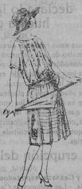
Vestidos de voile, adornos bordados para jovencitas de 13 a 15 años de ptas. 40