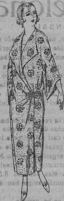
Batas de crespón estampado broche de adorno de ptas. 25