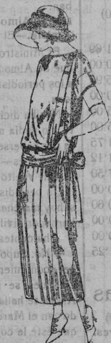
Vestidos de tricot de seda, en negro, azul y colores moda, adornos bordados a mano de ptas. 125