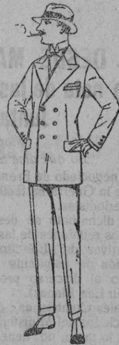
Trajes de lanilla, meltón, estambre, vicuña, jerga, etc. de ptas. 40 a 150