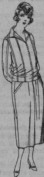
Blusas de voile de seda, listada, colores moda de ptas. 23 a 27 Faldas de popeline, estambre, etc., en negro, azul y color de ptas. 30 a 45