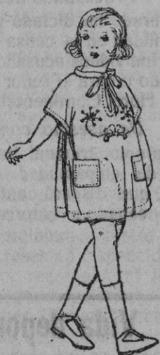
delantales de voile, colores moda, adornos bordados, para niñas de 3 a 6 años de ptas 12 a 18