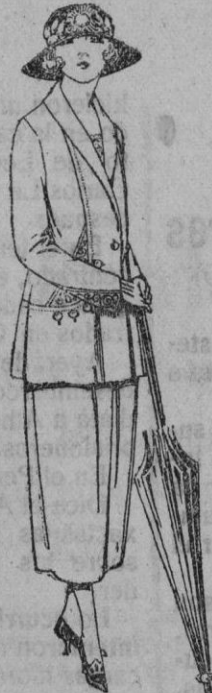
Trajes sastre de sarga inglesa, popeline, etc., adornos bordados, chaqueta forrada de seda, en marino, negro y colores moda de ptas. 125 a 160