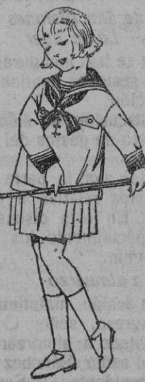
Trajes modelo "Marinera Inglesa", de dril, otomán o satén blanco, para niñas de 4 a 9 años de ptas. 20 a 35

Gorras, Sombreros, Cinturones, Calcetines, Corbatas, Pañuelos, Fajas, Ligas, Tirantes, etc., etc.