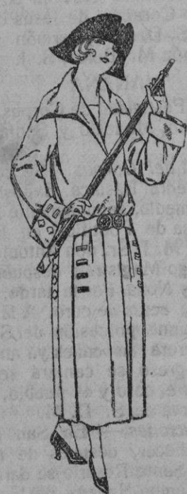
Abrigos de gabardina inglesa, impermeabilizada, en negro azul y color de ptas. 85 a 200