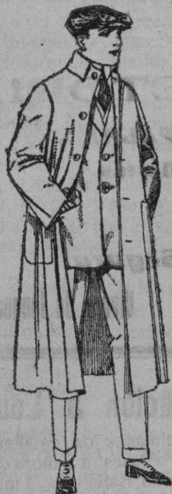
Guardapolvos de dril, igual al modelo de ptas. 10 a 20

Madrid, Barcelona, Alicante, Almería, Bilbao, Cádiz, Cartagena, Gijón, Granada, Málaga, Santander, Sevilla, Valencia, Valladolid, Zaragoza