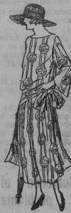
Vestidos de velo de algodón, estampado, diferentes dibujos de ptas. 55 a 70

Precio fijo.--Pídase el catálogo general.--Ventas al contado