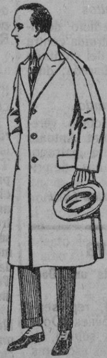
Gabanes de meltón, gabardina, etc. de ptas. 60 a 180