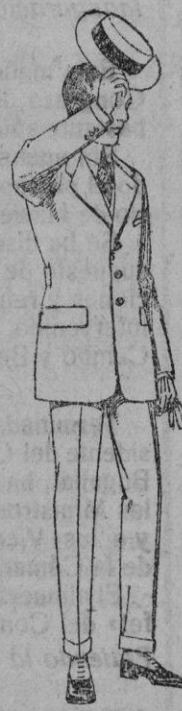
Trajes modelo Sport, de lanilla, meltón, etc. de ptas. 52 a 125