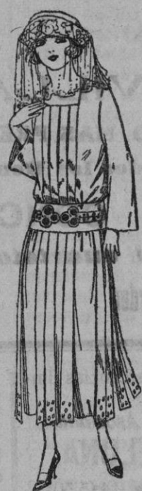
Vestidos de popeline, sarga, etc., en negro, azul y color, adornos bordados de ptas. 95 a 110