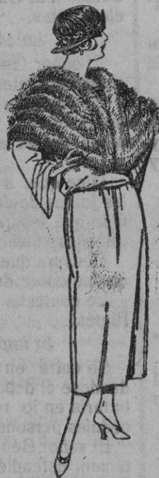
Capelinas de marabú diferentes modelos, en negro, blanco y marrón de ptas. 30 a 75