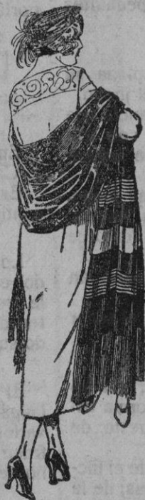
Echarpes de seda, diferentes dibujos y calidades de ptas. 20 a 200