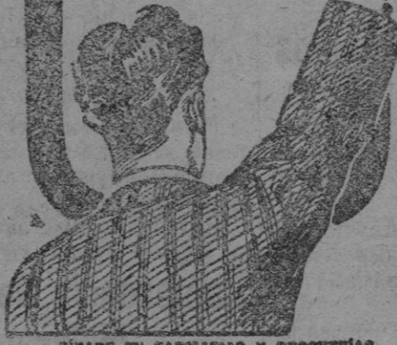
PIÑASE EN FARMACIAS Y DROGUERIAS

y los Médicos le llaman el REMEDIO DE LOS DÉBILES