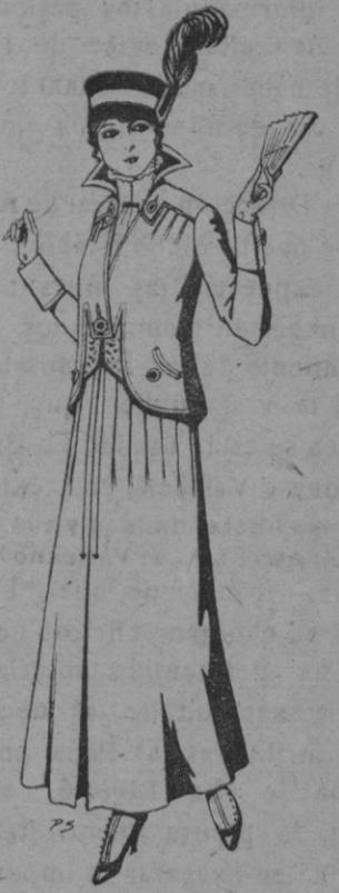
Trajes de lana negra azul y color para Señora Ptas. 55