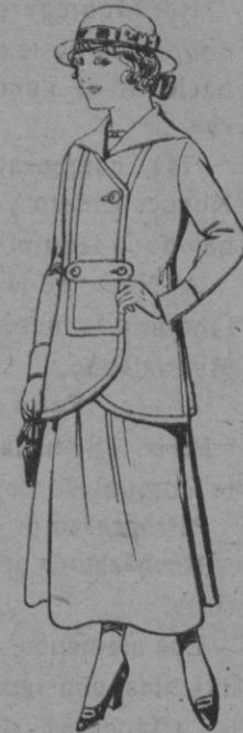
Trajes de lanilla para jovencitas de 13 a 15 años De ptas. 27 a 30