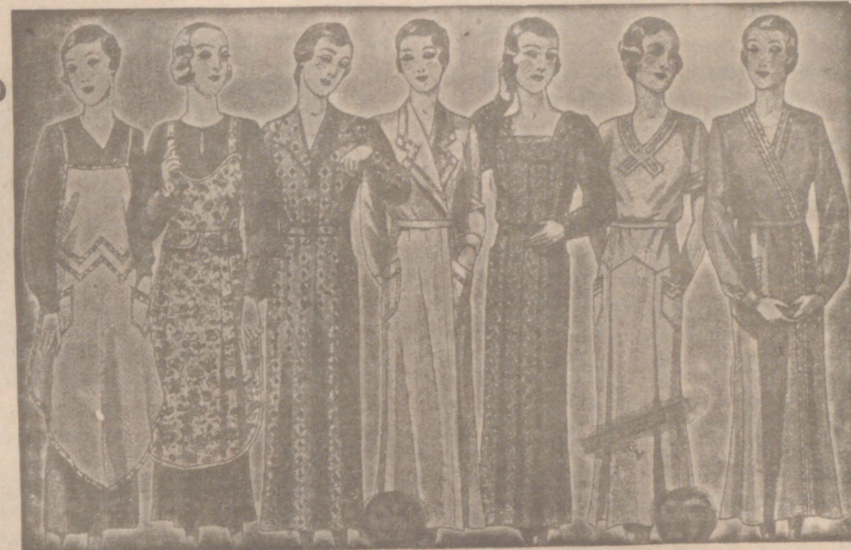
Vestidos, batas, kimonos de bañistas, percales o trovacos, de 7, 8, 9, 10, 12 y 14 ptas