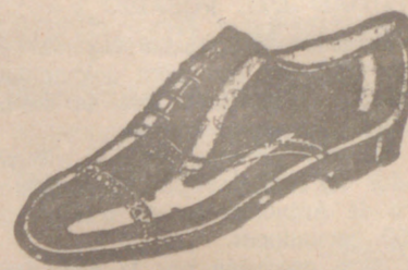
Zapatos los mejores, 18 ptas.