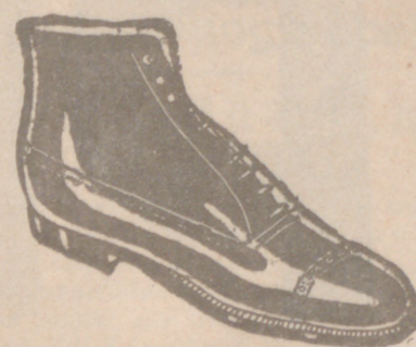
Botas las mejores, 19 80 ptas.

Venta directa del fabricante al consumidor