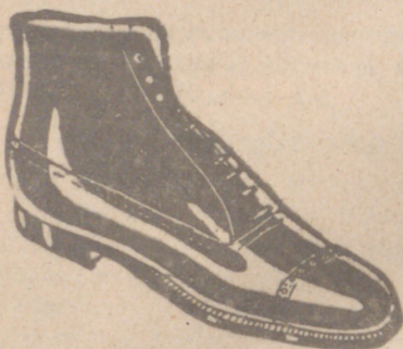
Botas los mejores. 19.80 ptas.

Venta directa del fabricante al consumidor