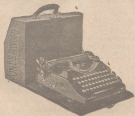
Máquina UNDERWOOD portátil último modelo, a 625 pesetas