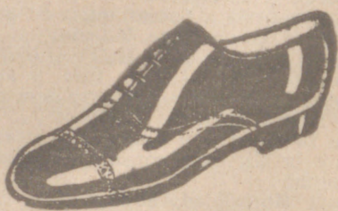
Zapatos los mejores. 18 ptas