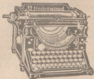
Máquinas escribir UNDERWOOD. admite papel de 26 centímetros de ancho, a 850 ptas. Máquina 5/14 admite papel hasta 55 centímetros, a pesetas 1.000, según numeración.