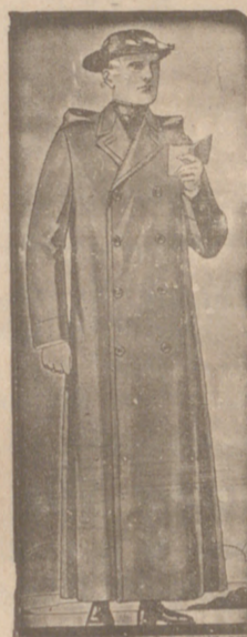
Guardapolvos de dril, a 20, 22 y 25 pesetas.

Cajas de caudales de absoluta seguridad y REFRACTARIAS marca