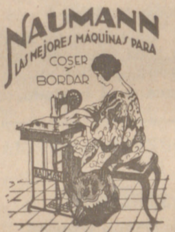
Máquinas coser NAUMANN. Bobina central. Precios más barato que nadie.