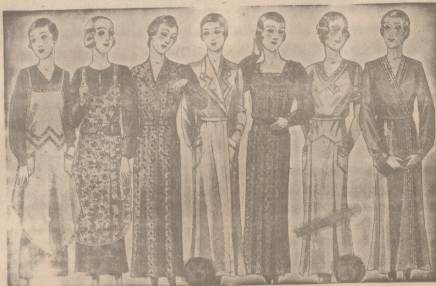
Vestidos, batas, kimonos de bañistas, percales o trovales, etc. 7, 8, 9, 10, 12 y 14 ptas.

Casa Munguía ( ) Plaza Mayor, 48 y Lain Calvo, 9 Sucursal: Plaza Mayor, 5 BURGOS Primera casa en confecciones para caballero, señora, jóvenes y niños. Tejidos, Pañería y Sastrería