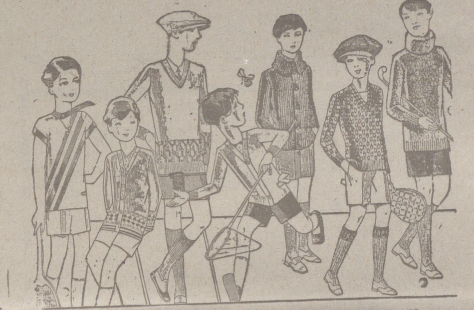
Jerseys para niños, dibujos novedad, desde 4, 4,50 $, 6, 7, 8, 10 y 12 ptas. Siempre gran surtido para elegir

PARA QUE PUEDA VD. MEJORAR SU RECEPTOR LE ayudamos con 100 ptas.