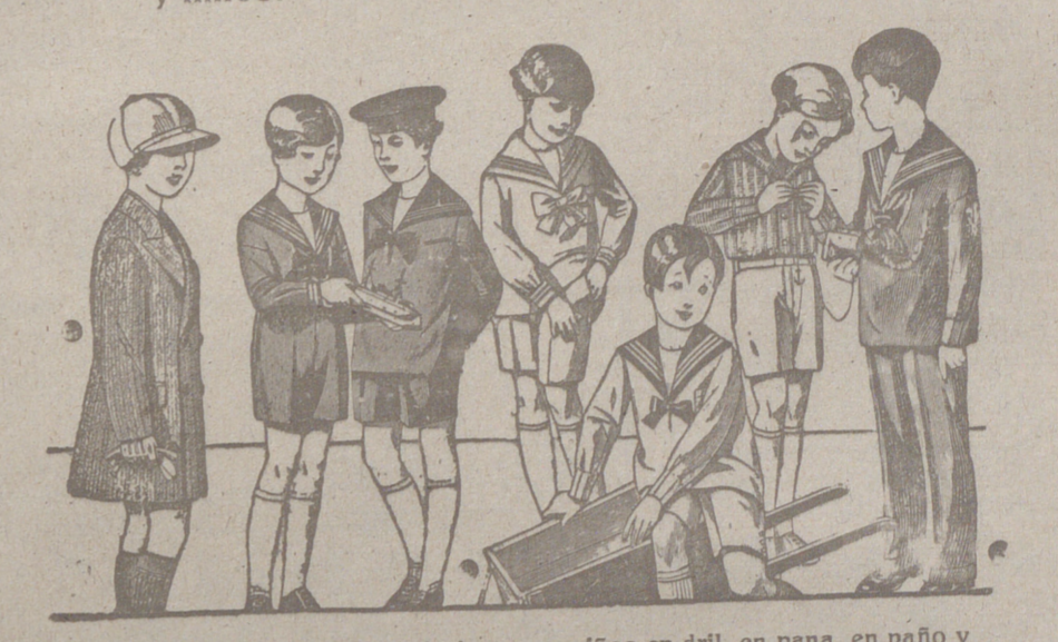
50 modelos distintos en trajectos para niños en dril, en pana, en paño y en jergas azules, de 10 a 40 pesetas.