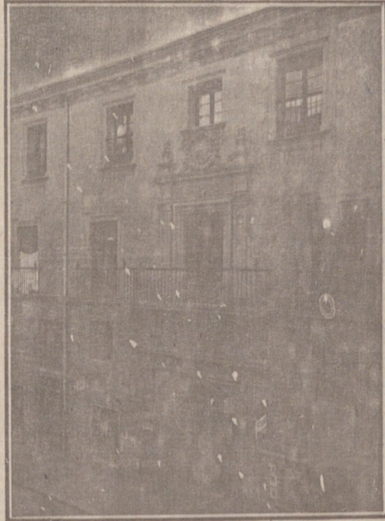
Entrada a las Oficinas de la Federación y MUTUALIDAD AGRÍCOLA BURGALESA. Calle de Santander, números 10, 12 y 14, Burgos.

Se hallan establecidas en su planta baja las Oficinas y talleres de máquinas de «El Castellano» y «El Defensor de los Labradores»