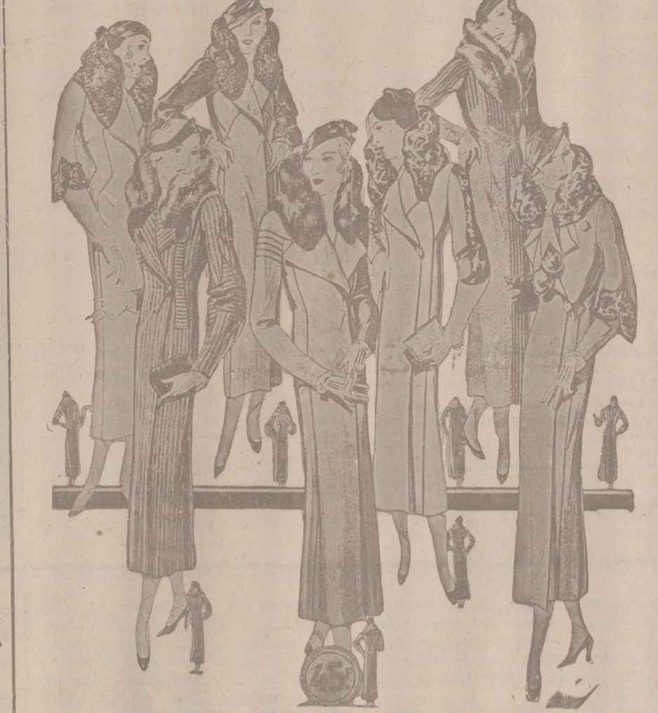
50 Modelos distintos en Abrigos Gamuzas NOVEDAD.—Modelos, creación Parísien a 25, 30, 40, 50, 60, 70, 80 y 100 pesetas

FÁBRICA DE PAÑOS Y NOVEDADES DE LANA Y ESTAMBRE Especialidad en merinos para manteos BAYGUAL Y LLONGH SUCESOR SABADELL Despacho: Calle de Villa, 58