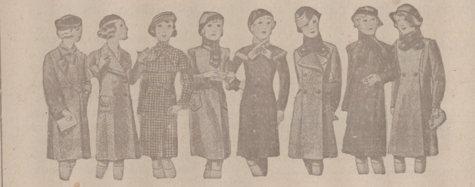
ABRIGOS PARA NIÑAS — MODELOS NOVEDAD, de 18, 18, 20, 25, 30 y 40 pesetas.

Casa Munguía Plaza Mayor 42 y Lala Calvo 9 Sucursal: Plaza Mayor, 5 BURGOS Primera casa en confecciones para caballero, señora, jóvenes y niños. — Tejidos, Pañería y Sastrería.