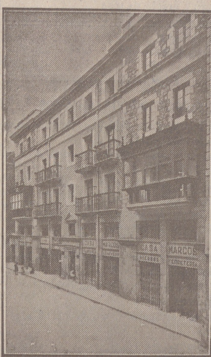
Fachada, por la calle de la Moneda, números 15 y 17, de la CASA SOCIAL propiedad de la Federación Burgalesa de Sindicatos Agrícolas Católicos.

Un accidente en vuestros obreros, criados, pastores o en vosotros mismos, puede causar grave daño económico o la ruina en vuestra casa.