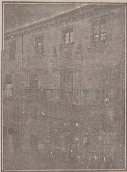
Entrada a las Oficinas de la Federación y MUTUALIDAD AGRÍCOLA BURGALESA. Calle de Santander, números 10, 12 y 14. Burgos.

En ella están las Oficinas de la FEDERACIÓN, CAJA DE AHORROS, MUTUALIDAD AGRÍCOLA BURGALESA y Redacción y Administración de «El Castellano» y «El Defensor de los Labradores»