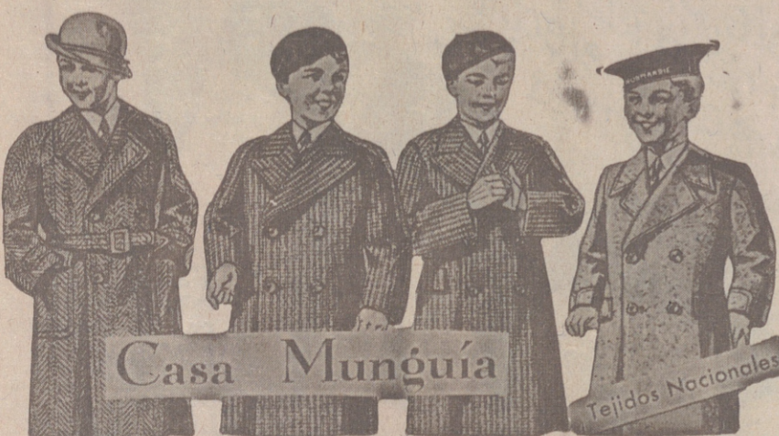
Gabanes para niños modelos últimos, de 18 a 60 pesetas

Casa Munguía Plaza Mayor 42 y Lala Calvo 9 Sucursal: Plaza Mayor, 5 BURGOS Primera casa en confecciones para caballero, señora, jóvenes y niños. — Tejidos, Pañería y Sastrefía.