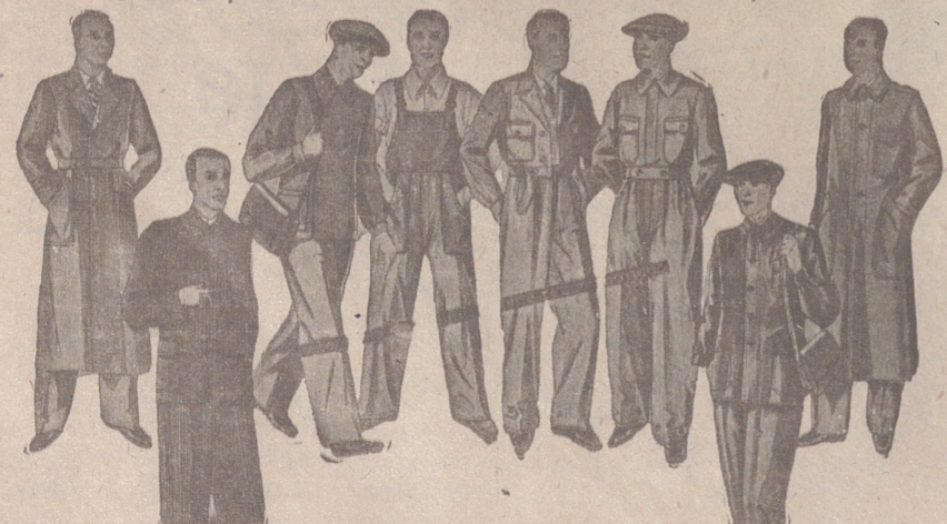
Guardapolvos, de 8 a 20 pesetas. Peñizas, de 18 a 120 pesetas Buzos, de 7 a 25 pesetas. Pantalón tirante, de 7 a 12 pesetas