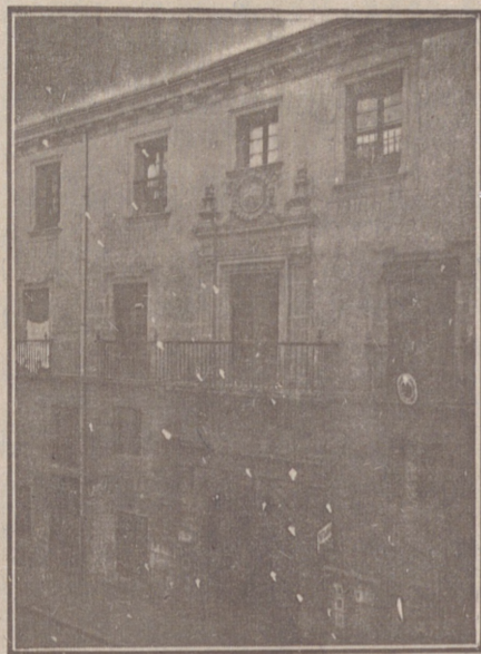
Entrada a las Oficinas de la Federación y MUTUALIDAD AGRÍCOLA BURGALESA. Calle de Santander, números 10, 12 y 14. Burgos.

En ella están las Oficinas de la FEDERACIÓN, CAJA DE AHORROS, MUTUALIDAD AGRÍCOLA BURGALESA y Redacción y Administración de «El Castellano» y «El Defensor de los Labradores»