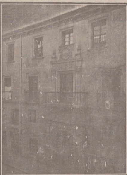
Entrada a las Oficinas de la Federación y MUTUALIDAD AGRÍCOLA BURGALESA. Calle de Santander, números 10, 12 y 14. Burgos.

En ella están las Oficinas de la FEDERACIÓN, CAJA DE AHORROS, MUTUALIDAD AGRÍCOLA BURGALESA y Redacción y Administración de «El Castellano» y «El Defensor de los Labradores»