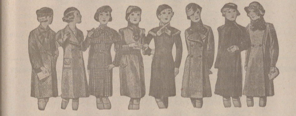
ABRIGOS PARA NIÑAS - MODELOS NOVEDAD, de 15, 18, 20, 25, 30 y 40 pesetas.

Casa Munguía. Plaza Mayor 42 y Lala Calvo 9. Sucursal: Plaza Mayor, 5 BURGOS.