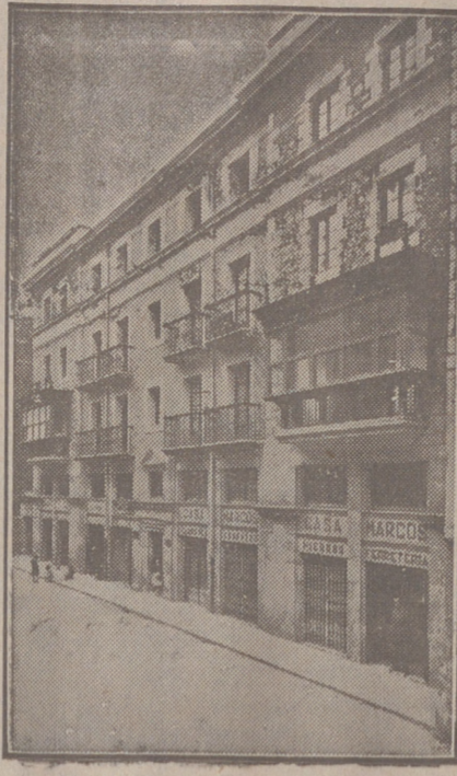
Fachada, por la calle de la Moneda, números 18 y 17, de la CASA SOCIAL propiedad de la Federación Burgalesa de Sindicatos Agrícolas Católicos.

Se hallan establecidas en su planta baja las Oficinas y talleres de máquinas de «El Castellano» y «El Defensor de los Labradores»