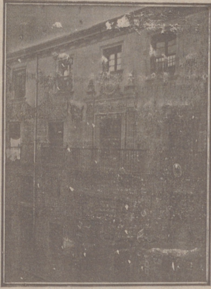
Entrada a las Oficinas de la Federación y MUTUALIDAD AGRÍCOLA BURGALESA. Calle de Santander, números 10, 12 y 14. Burgos.

Un accidente en vuestros obreros, criados, pastores o en vosotros mismos, puede causar grave daño económico o la ruina en vuestra casa.