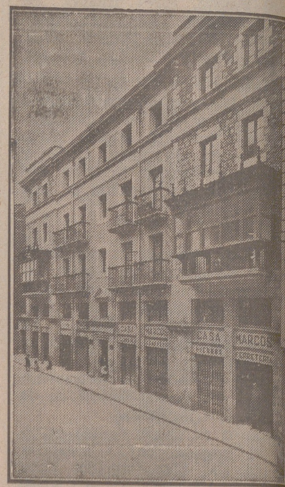
Fachada, por la calle de la Moneda, números 15 y 17, de la CASA SOCIAL propiedad de la Federación Burgalesa de Sindicatos Agrícolas Católicos.

Se hallan establecidas en su planta baja las Oficinas y talleres de máquinas de «El Castellano» y «El Defensor de los Labradores»