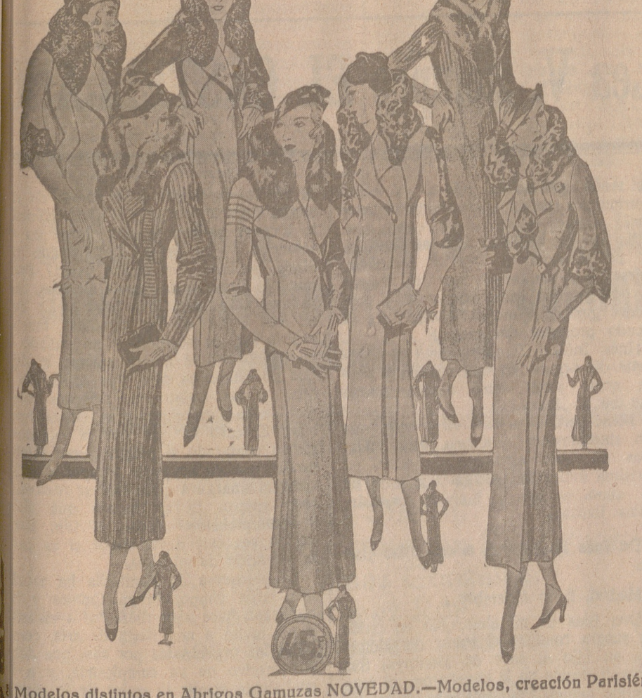
Modelos distintos en Abrigos Gamuzas NOVEDAD.—Modelos, creación Parísien a 25, 30, 40, 50, 60, 70, 80 y 100 pesetas