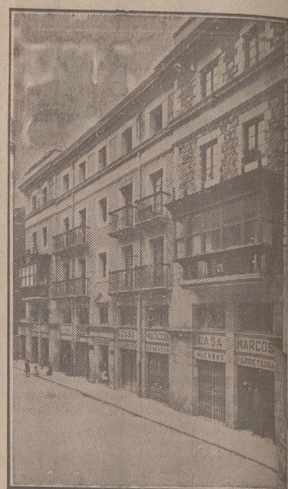
Fachada, por la calle de la Moneda, números 15 y 17, de la CASA SOCIAL propiedad de la Federación Burgalesa de Sindicatos Agrícolas Católicos.

Se hallan establecidas en su planta baja las Oficinas y talleres de máquinas de «El Castellano» y «El Defensor de los Labradores»