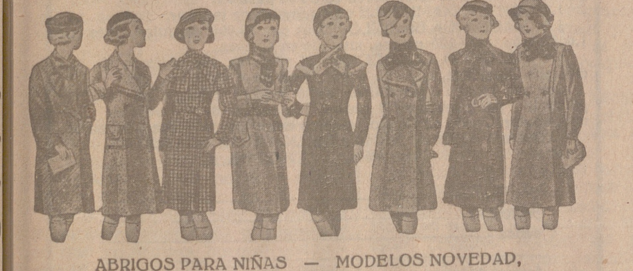
ABRIGOS PARA NIÑAS — MODELOS NOVEDAD, de 15, 18, 20, 25, 30 y 40 pesetas.