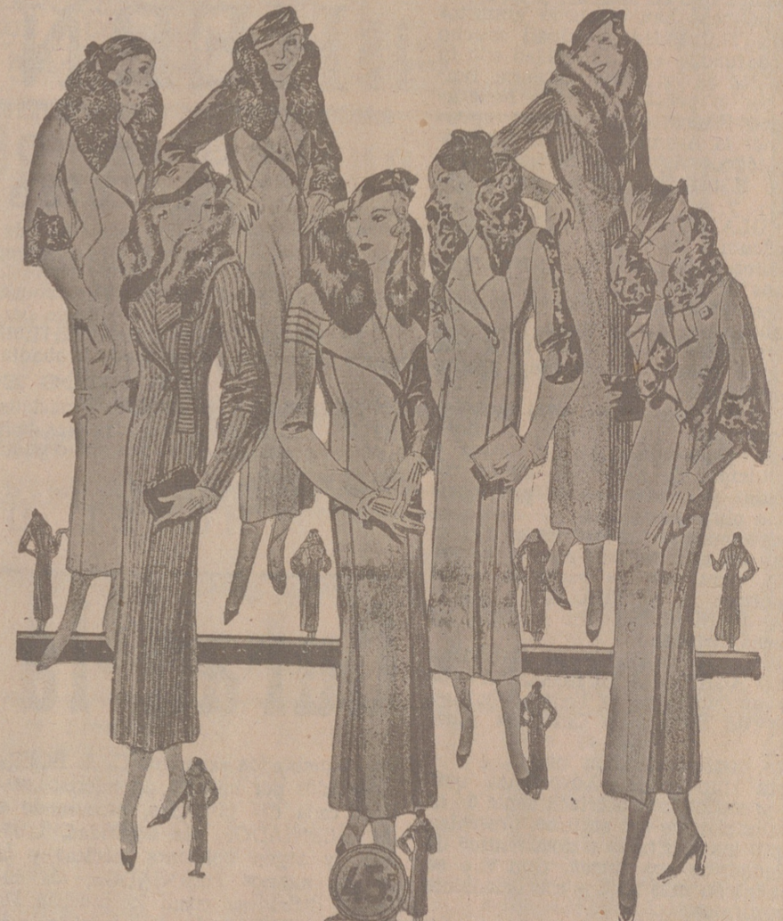
50 Modelos distintos en Abrigos Gamuzas NOVEDAD.—Modelos, creación Parísien a 25, 30, 40, 50, 60 70, 80 y 100 pesetas