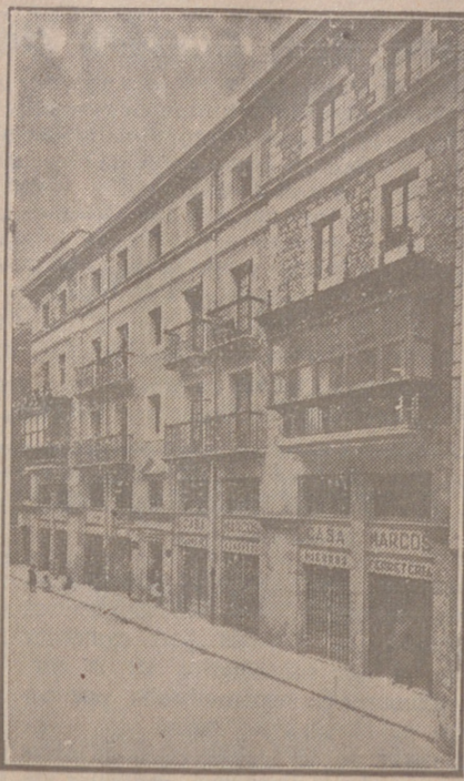
Fachada, por la calle de la Moneda, números 15 y 17, de la CASA SOCIAL propiedad de la Federación Burgalesa de Sindicatos Agrícolas Católicos.

No confundirse: Calle de Santander, (Casa de la Federación) - Burgos