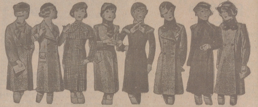
ABRIGOS PARA NIÑAS — MODELOS NOVEDAD de 15, 18, 20, 25, 30 y 40 pesetas

Primera casa en confecciones para caballero, señora, jóven y niños. — Tejidos, Pañería y Sastrería.