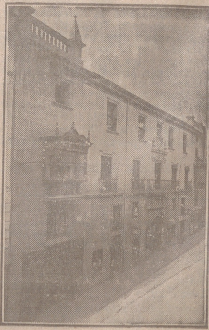
Fachada, por la calle de Santander, 10, 12 y 14, de la CASA SOCIAL propiedad de la Federación Burgalesa de Sindicatos Agrícolas Católicos.

En ella están las Oficinas de la FEDERACIÓN, CAJA DE AHORROS, MUTUALIDAD AGRÍCOLA BURGALESA y Redacción y Administración de «El Castellano» y «El Defensor de los Labradores»