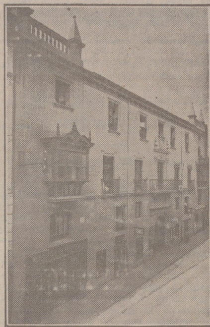
Fachada, por la calle de Santander, 10, 12 y 14, de la CASA SOCIAL propiedad de la Federación burgalesa de Sindicatos Agrícolas Católicos.

En ella están las Oficinas de la FEDERACIÓN, CAJA DE AHORROS, MUTUALIDAD AGRICOLA BURGALESA y Redacción y administración de «El Castellano» y «El Defensor de los Labradores».