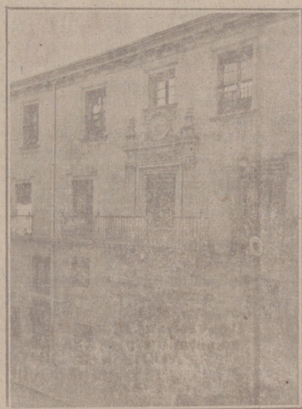
Entrada a las Oficinas de la Federación y MUTUALIDAD AGRÍCOLA BURGALESA Calle de Santander, números 10, 12 y 14 Burgos