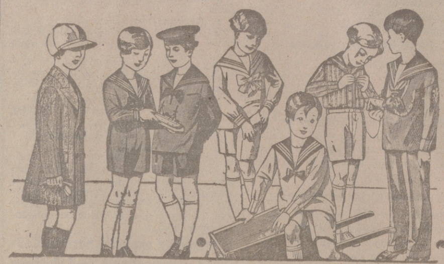
50 modelos distintos en trajecitos para niños en dril, en pana, en paño, y en jergas, azules, de 10 a 40 pesetas.

Primera casa en confecciones para caballero, señora, jóvenes y niños. - Tejidos, Pañería y Sastrería.