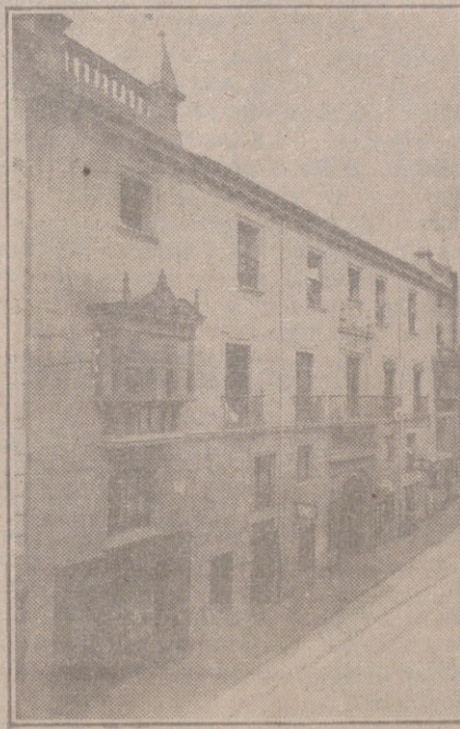
Fachada, por la calle de Santander, 10, 12 y 14, de la CASA SOCIAL propiedad de la Federación burgalesa de Sindicatos Agrícolas Católicos.

En ella están las Oficinas de la FEDERACIÓN, CAJA DE AHORROS, MUTUALIDAD AGRÍCOLA BURGALESA y Redacción y administración de 'El Castellano' y 'El Defensor de los Labradores'.