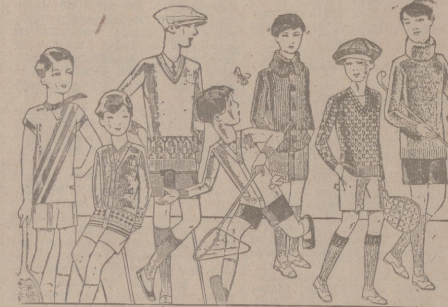
Jerseys para niños, dibujos novedad, desde 4, 4,50 5, 6, 7, 8, 10 y 12 ptas. Siempre gran surtido para elegir