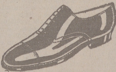
Zapatos piel de 1.ª, del 58 al 45, a 18 ptas. Zapato charol, a 19'50. LIMPIEZA GRATIS