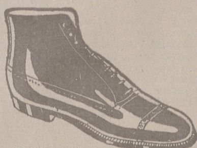
Botas clase 1.ª «Segarra», a 19'50. Piesetas. Piel de hierro, a 19'50. Piel de hierro piso goma, a 18 ptas.