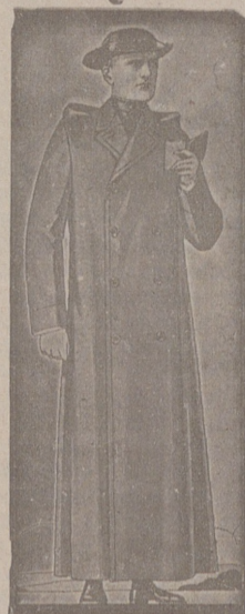
Impermeables, de 90, 100 y 115 ptas. Guardapolvos de drill forma dulteta, a 18, 20, 25 y 50 ptas.