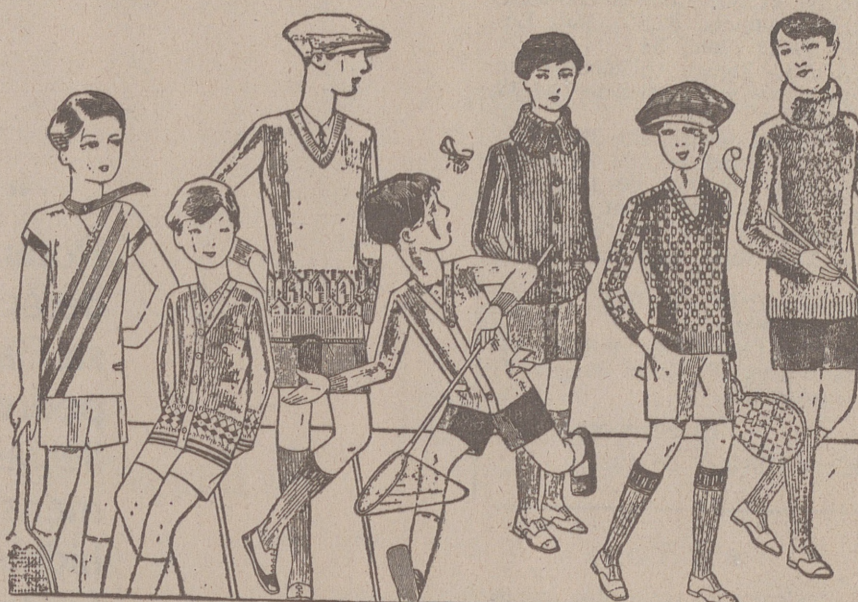
Jerseys para niños, dibujos novedad, desde 4, 4,50 5, 6, 7, 8, 10 y 12, plas. Siempre gran surtido para elegir