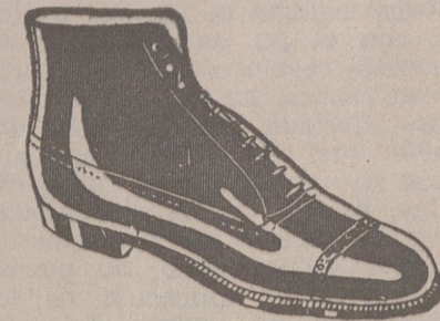
Botas en negro o color, a 19'80.—Piel de hierro, 19'50.—Piso goma, 18'00.—Fuerte campo, 16'75.