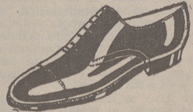
Zapatos todos los números, a 18 pesetas.—Cherol, a 19'50.—Cosido todo.