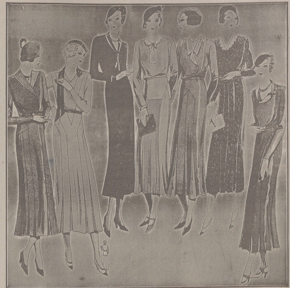
Vestidos de crepón y lana, modelos novedad, de 25, 50, 40, 50 y 60 pesetas.

Plaza Mayor 42 y Lala Calvo 3 Sucursal: Plaza Mayor, 15 BURGOS