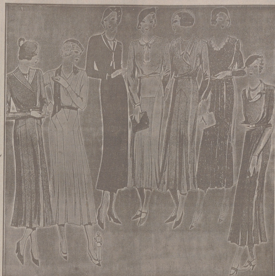
Vestidos de crepón y lana, modelos novedad, de 25, 30, 40, 50 y 60 pesetas.

Primera casa en confecciones para caballero, señora, jóvenes y niños. — Tejidos, Pañería y Sastrería.